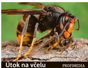
Útok na včelu

Sršně asijské jsou už v Německu. Ničí včelstva, útočí i na člověka.