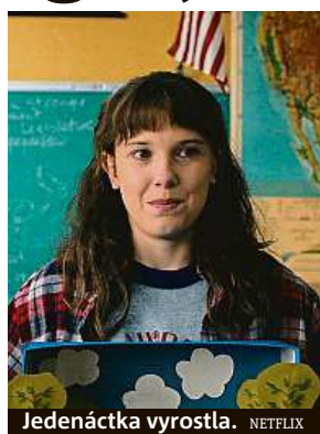
Jedenáctka vyrostla.

Co se obsazení týče, hostující hvězdy je zde například herec Robert Englund, představitel slavného Freddyho Kruegera ze série Noční můra z Elm Street. Ten tu hraje tak trochu jiného „vrahouna“. A co se týče produkčních hodnot, třicet milionů dolarů utracených za jednu epizodu je tu sakra vidět. O skvělém audiovizuálním zážitku tak není ani třeba mluvit. Další větších změn tu mnoho