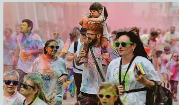
Sportovní akce Vybarvený běh v Kroměříži.