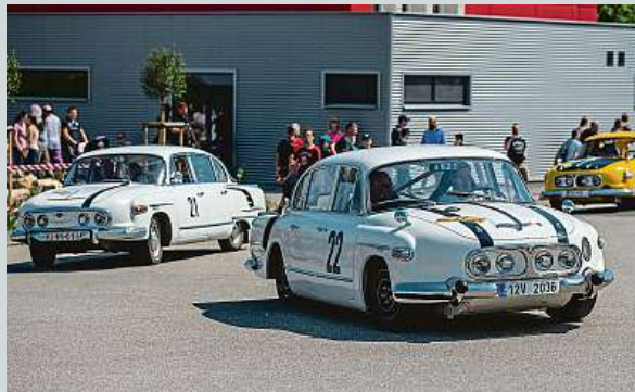
O víkendu se konaly Kopřivnické dny techniky, které představily slavné stroje.