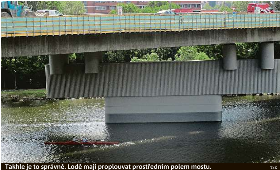
Takhle je to správně. Lodě mají proplouvat prostředním polem mostu. TSK

Oprava dopravní tepny uzavřela plavební dráhy v krajních polích mostu. „Na některé prosby neplatí,“ tvrdí TSK.