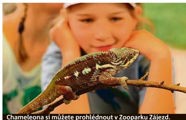
Chameleona si můžete prohlédnout v Zooparku Zájezd.

Pěkná minizoo se nachází také v rekreačním areálu Vrchbělá. „Vrchbélou si zamilují malí i velcí nejen proto, že se tam dá krásně relaxovat, poznávat okolí, jezdit na kole i na bruslích, hrát si na dětském hřišti anebo si dopřát trochu adrenalinu v lanovém centru. Magnetem jsou také zvířata v tamější minizoo. Velkým zážitkem je pozorovat je zblízka při krmení,“ dodává Jakub Kulhánek, vedoucí marketingu Středočeské centrály cestovního ruchu. Více informací najdete na www.strednicechy.cz . MET