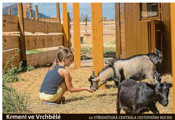
Krmení ve Vrchbělé

4x STŘEDOČESKÁ CENTRÁLA CESTOVNÍHO RUCHU