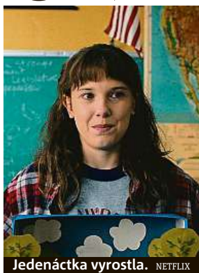
Jedenáctka vyrostla.

Co se obsazení týče, hostující hvězdy je zde například herec Robert Englund, představitel slavného Freddyho Kruegera ze série Noční můra z Elm Street. Ten tu hraje tak trochu jiného „vrahouna“. A co se týče produkčních hodnot, třicet milionů dolarů utracených za jednu epizodu je tu sakra vidět. O skvělém audiovizuálním zážitku tak není ani třeba mluvit. Další větších změn tu mnoho