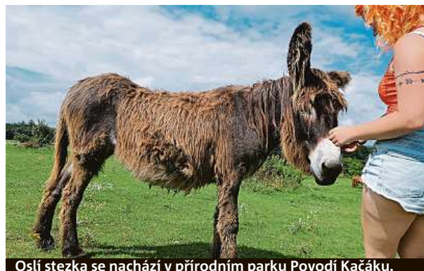
Oslí stezka se nachází v přírodním parku Povodí Kačáku.

ložení. Je to první porevoluční nestátní oficiální zoologická zahrada v České republice. Návštěvníci v ní poznají takové pány zvířat, jako jsou amazónan rudocasy, ara hyacintový, dvojzoborožec indický anebo tukan pestrý. Dohromady je v ní k vidění přes 420 zvířat ve zhruba 120 druzích. Zastoupeny jsou všechny skupiny od nejpočetnějších savců a ptáků přes plazy a obojživelníky až po ryby a bezobratlé ze všech kontinentů kromě Antarktidy.