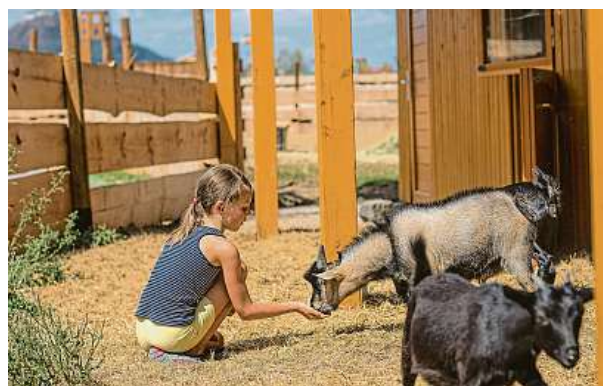
Krmení ve Vrchbělé

4x STŘEDOČESKÁ CENTRÁLA CESTOVNÍHO RUCHU