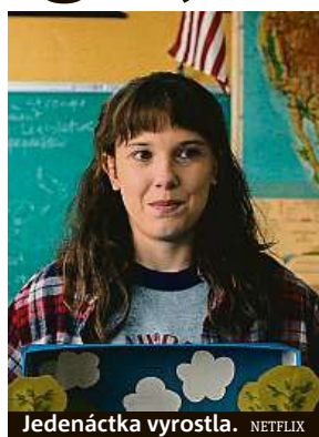
Jedenáctka vyrostla.

Co se obsazení týče, hostující hvězdy je zde například herec Robert Englund, představitel slavného Freddyho Kruegera ze série Noční můra z Elm Street. Ten tu hraje tak trochu jiného „vrahouna“. A co se týče produkčních hodnot, třicet milionů dolarů utracených za jednu epizodu je tu sakra vidět. O skvělém audiovizuálním zážitku tak není ani třeba mluvit. Další větších změn tu mnoho