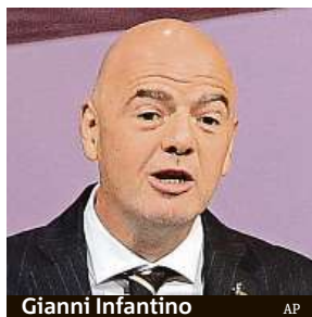
Gianni Infantino

Předseda Mezinárodní fotbalové federace Gianni Infantino byl na kongresu v Paříži potvrzen ve funkci na další čtyři roky. FIFA vede od roku 2016. Devětačtyřicetiletý Švýcar, který prosadil třeba rozšíření účastníků MS ze 32 na 48 od roku 2026, neměl protikandidáta. Zkušený funkcionář je teprve devátým předsedou FIFA za 115 let existence. PUR