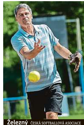
Železný ČESKÁ SOFTBALOVÁ ASOCIACE

Přesně za týden rozehrají čeští softbalisté v Praze první zápas mistrovství světa proti Novému Zélandu.