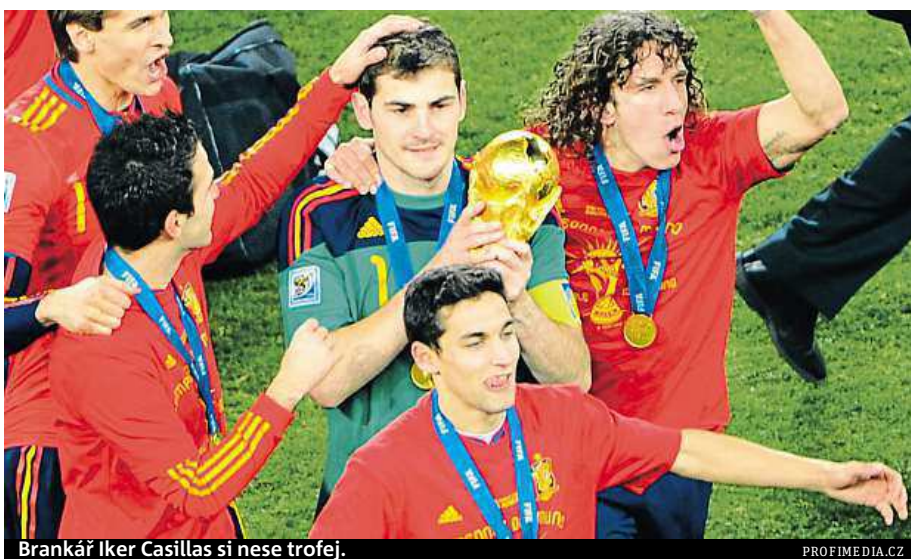
Brankář Iker Casillas si nese trofej.

A stejný není samozřejmě ani tým, přibyli někteří nováčci, stálíce jako Iniesta nebo Xavi jsou starší. Velká naděje se vkládá do čerstvě doléčeného útočníka Atlétika Madrid Diega Costy, který patří k nejlepším střelcům