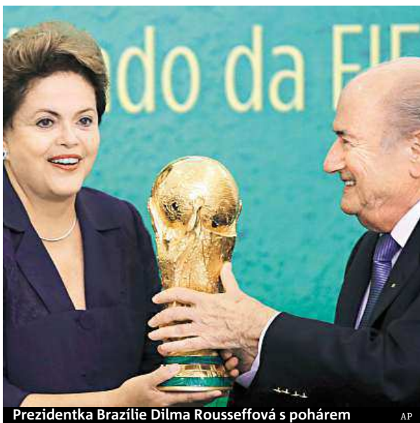
Prezidentka Brazílie Dilma Rousseffová s pohárem

Pořádání šampionátu v zemi, která se potýká s velkými ekonomickými problémy a také obrovskou krimina-