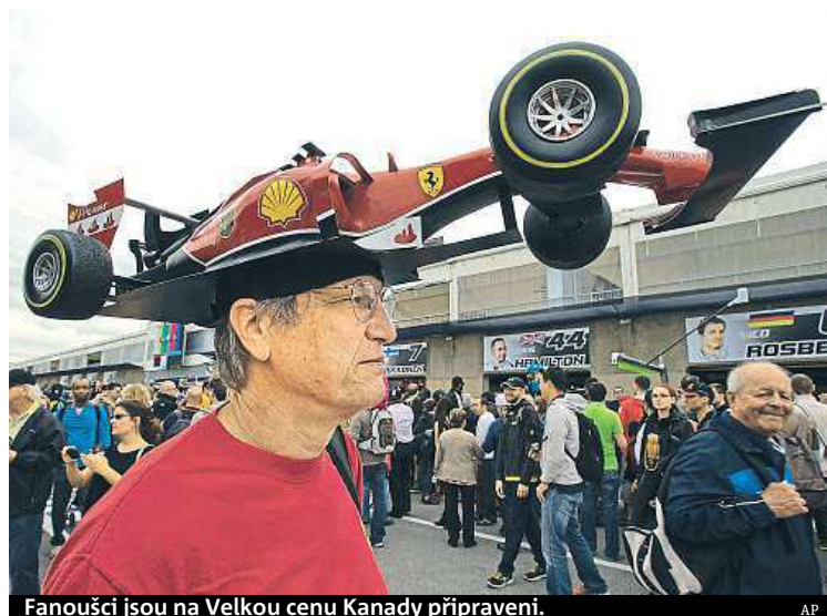
Fanoušci jsou na Velkou cenu Kanady připraveni.