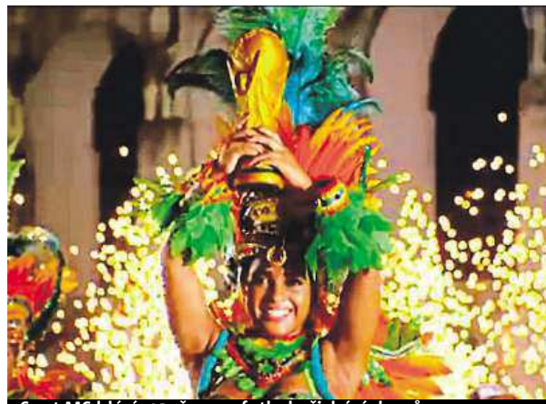
Spot MS hlásí: 12. června fotbal přichází domů.

Velmi emotivní spot vyrobila pro chilskou reprezentaci firma Banco de Chile. Příkladem odvážného boje a překonání jich samých jsou hráčům horníci, kteří zůstali v roce 2010 zavalení pod zemí sedmdesát dní. „Když jsme zůstali dole, věděli jsme, že nahoře jsou lidé, kteří nám věří,“ promlouvá je-