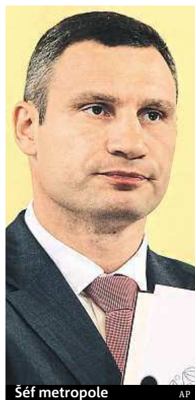
Šéf metropole AP

V následném projevu přislíbil skoncovat s korupcí a vytvořit z Kyjeva příjemné místo k životu, které se zařadí k moderním evropským met-