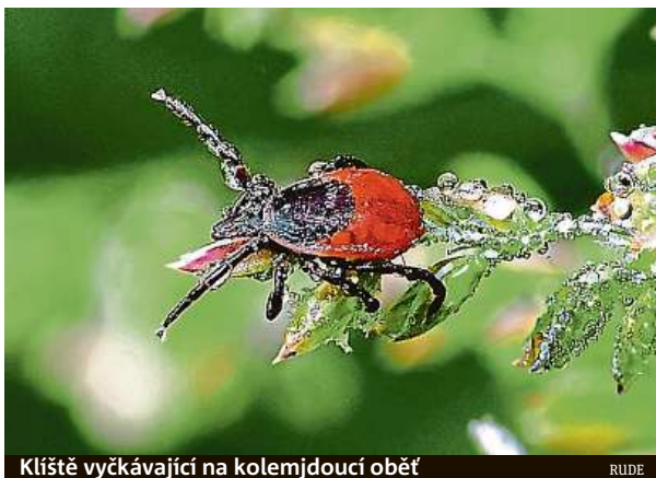
Klíště vyčkávající na kolemjdoucí oběť

Podle dat starých několik dnů ze serveru Klíště.cz je nej-