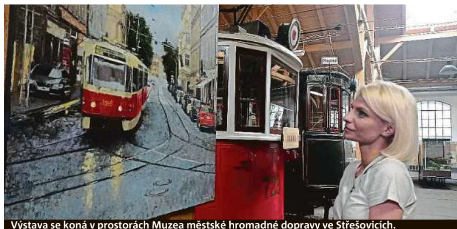
Výstava se koná v prostorách Muzea městské hromadné dopravy ve Střešovicích.