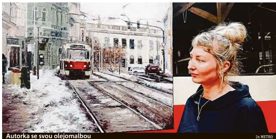
Autorka se svou olejomalbou