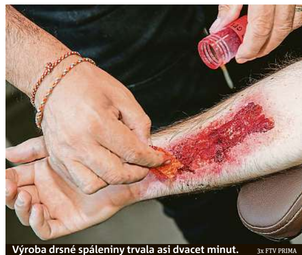
Výroba drsné spáleniny trvala asi dvacet minut.

Několika hercům bylo přiděleno téma. Já jsem dostala cukrovku a jsem za to ráda. Je mi to blízké téma, protože můj táta je cukrovkář. Hodně lidí ví, co cukrovka je, ale málokdo tuší, jak zasáhnout, když cukrovkář dostane šok. V tu chvíli totiž takový člověk vypadá opilý, a dokonce je z něj cítit alkohol. Mnoho lidí takového člověka překročí, protože si myslí, že je to nějaký opilec. Píše mi i spousta lidí s touto nemocí, že je dobře, že se o ní mluví. PUR