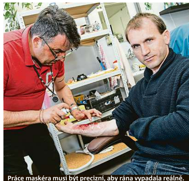
Práce maskéra musí být precizní, aby rána vypadala reálně.