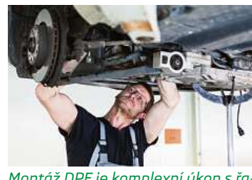
Montáž DPF je komplexní úkon s řadou kroků. Aby filtr bezvadně fungoval musí být provedena precizně, nejlépe v autorizovaném servisu.