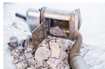
Z DPF testovacího vozu byla odstraněna voštinová keramická vložka s drahými kovy.