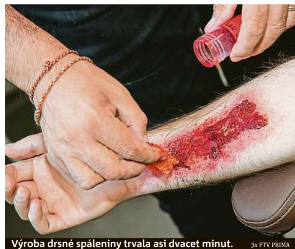
Výroba drsné spáleniny trvala asi dvacet minut.

Několika hercům bylo přiděleno téma. Já jsem dostala cukrovku a jsem za to ráda. Je mi to blízké téma, protože můj táta je cukrovkář. Hodně lidí ví, co cukrovka je, ale málokdo tuší, jak zasáhnout, když cukrovkář dostane šok. V tu chvíli totiž takový člověk vypadá opilý, a dokonce je z něj cítit alkohol. Mnoho lidí takového člověka překročí, protože si myslí, že je to nějaký opilec. Píše mi i spousta lidí s touto nemocí, že je dobře, že se o ní mluví. PUR