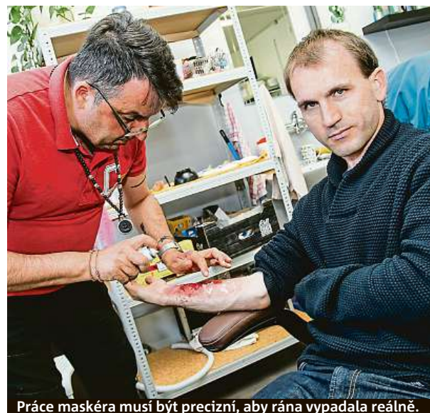
Práce maskéra musí být precizní, aby rána vypadala reálně.