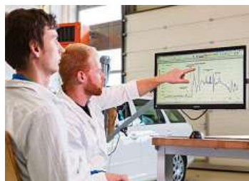
Přímou v kabině vozu byly naměřeny vysoké koncentrace karcinogenních pevných částic.