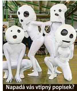
Napadá vás vtipný popisek?

Napište bublinu a reagujte na sloupek na: www.facebook.com/denikmetro