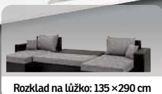
Rozklad na lůžko: 135 x 290 cm

Oblouková lampa, A** až E, kov / bílé látkové stínidlo, 218 cm, E27 / 40W, 0307071-00