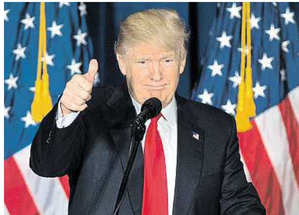
Donald Trump své kandidatuře věří.

Je vulgární a radikální. Urážlivě mluví o menšinách. Přesto má Trump šanci být americkým prezidentem.