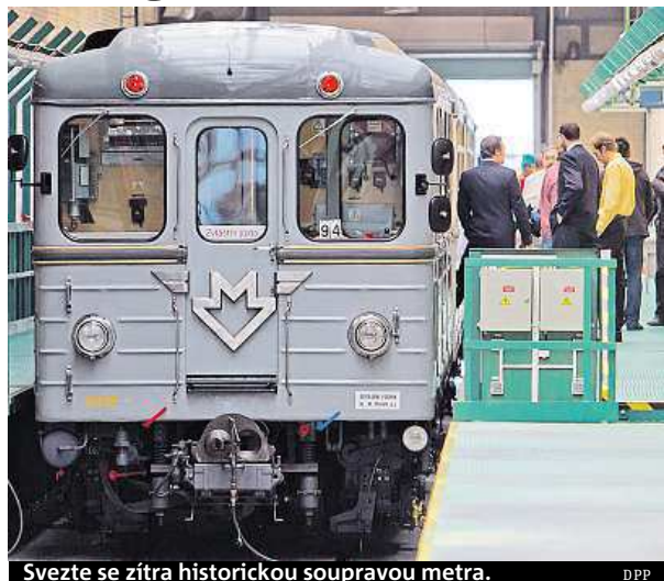
Svezte se zítra historickou soupravou metra.