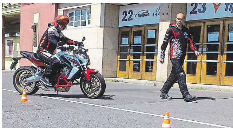
Jediné místo v Praze pro testy je před sportovní halou v Holešovicích. METRO

Řidiči skoro denně potkávají vozy autoškol. Mladí nezkušení řidiči většinou jedou opatrně – tedy pomalu. Proto je většina řidičů rychle předjede. Jenže nyní je třeba si dát při předjížděním manévru větší pozor. Před vozidlem autoškolky může být totiž „schovaný“ ještě jeden účastník provozu, a to žák autoškolky na motorce.