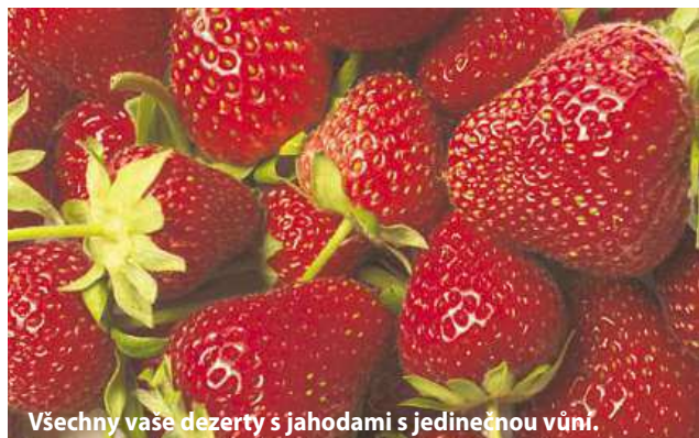
Všechny vaše dezerty s jahodami s jedinečnou vůní.