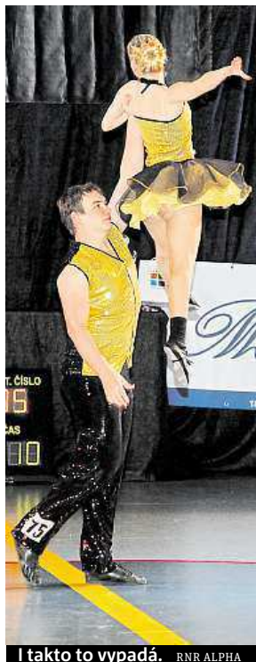
I takto to vypadá. RNR ALPHA

Pro diváky jsou podle mých zkušeností nejatraktivnější akrobacie prováděné již od juniorských kategorií. Náročnost akrobacie je samozřejmě odlišná podle