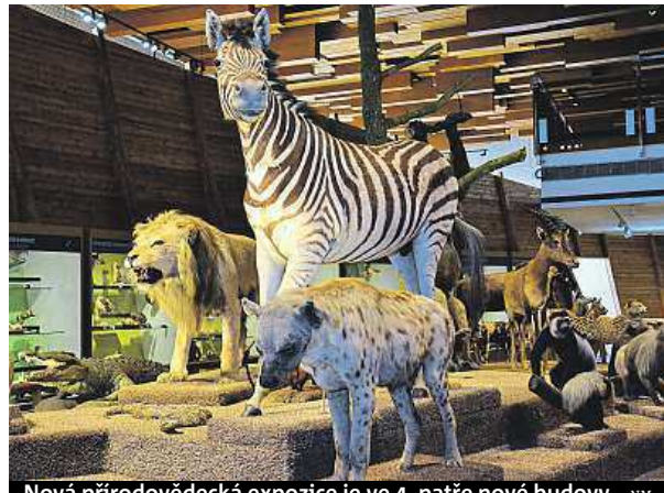
Nová přírodovědecká expozice je ve 4. patře nové budovy. NM

Expozice zavádí návštěvníky do fascinujícího světa živočišné říše – shledají se v ní s některými slavnými exponáty ze staré expozice. Zblízka si mohou opět prohlédnout například ledního medvěda Alíka z pražské zoo, losa evropského, který je považován za jednoho z prvních losů na našem území po několika