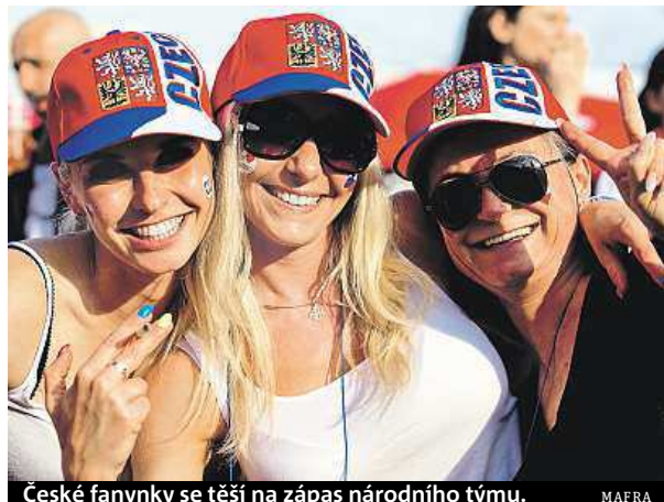
České fanky se těší na zápas národního týmu.