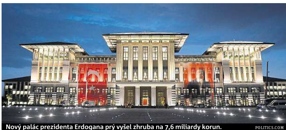
Nový palác prezidenta Erdogana prý vyšel zhruba na 7,6 miliardy korun.

Pokud Erdoganovi a jeho mateřské Straně spravedlnosti a rozvoje (AKP) vyjde plán a po letošních volbách 7. června prosadí novou ústavu, zůstane v paláci hodně dlouho. Změní to Turecko, tvrdí