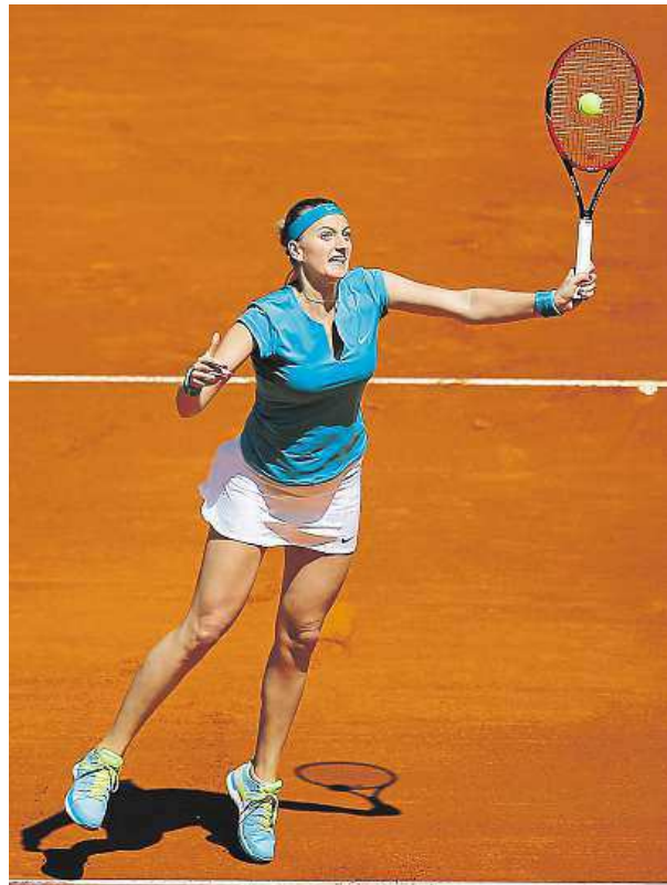
Petra Kvitová potřebovala na postup tři sety.

Paradoxně nepostoupila pouze Plíšková, jež po triumfu v Praze už třetí měsíc za sebou kandiduje na ocenění WTA vycházející hvězda měsíce. Třiatřicetiletá Plíšková nestačila na Francouzku Caroline Garciaovou, které podlehl 2:6, 6:4 a 1:6. Právě Garciaová byla nedávno ve fedcupovém výběru Francie při semifinále Fed Cupu v Ostravě, tam ji ale porazily Šafářová i Kvitová. PAVEL URBAN