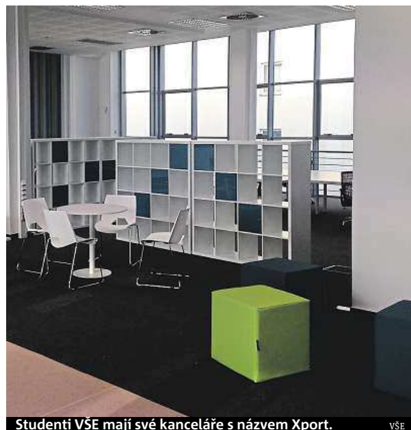
Studenti VŠE mají své kanceláře s názvem Xport. VŠE

Jedním z nejstarších inkubátorů u nás je inkubátor ČVUT,