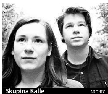
Skupina Kalle