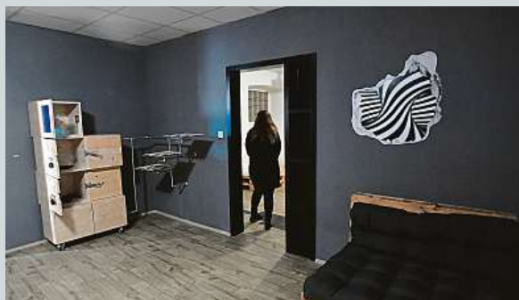
Jaký je jeden obyčejný den v domácnosti člověka s Alzheimerovou nemocí.