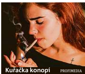
Kuřačka konopí

Děti, jejichž matky v těhotenství užívaly marihuanu, trpí nadměrnou tvorbou tuku a zvýšenou hladinou cukru v krvi.