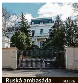
Ruská ambasáda MAFRA

K personálnímu oklešťování dlouhodobě dochází i na lince Praha–Moskva