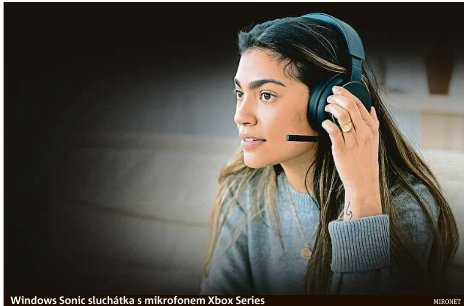
Windows Sonic sluchátka s mikrofonom Xbox Series

Pořídte si designová sluchátka s mikrofonom Xbox Series v internetovém obchodu Mironet.cz za 999 korun.