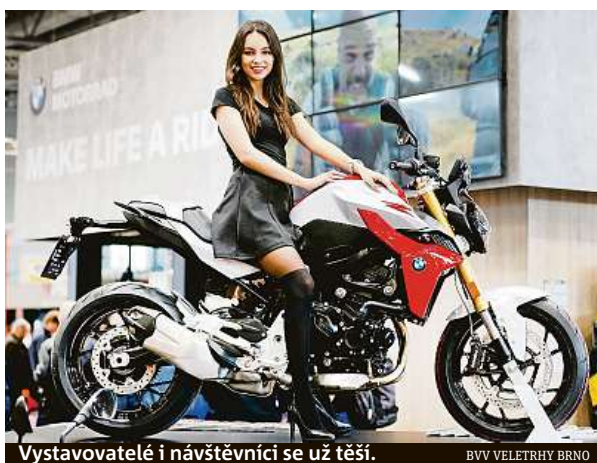
Vystavovatelé i návštěvníci se už těší. BVV VELETRHY BRNO

Ale už na podzim se dalo hovořit o úspěchu. Jak v Brně konstatují, sezona byla v posledních měsících roku 2021 úspěšná. „Podzimní sezona ukázala, že i přes objektivní potíže mají veletrhy důvěru firem. Podle průzkumů a zpětné vazby od většiny vystavovatelů veletrhy potvrdily své místo v jejich obchodní a marketingové strategii. Firmy dosáhly na cíle, jež svou účastí sledovaly, a vyhodnotily své působení na veletrhu