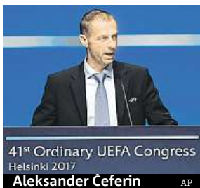
41. Ordinary UEFA Congress Helsinki 2017 Aleksander Čeferin

Každé z 55 členských asociací včetně české slíbil takzvanou platbu solidarity ve výši milionu eur (27 milionů korun) ze zisků UEFA. „Je to podíl z úspěšnosti našich soutěží národních mužstev. UEFA tu není proto, aby hromadila bohatství,“ řekl Čeferin.