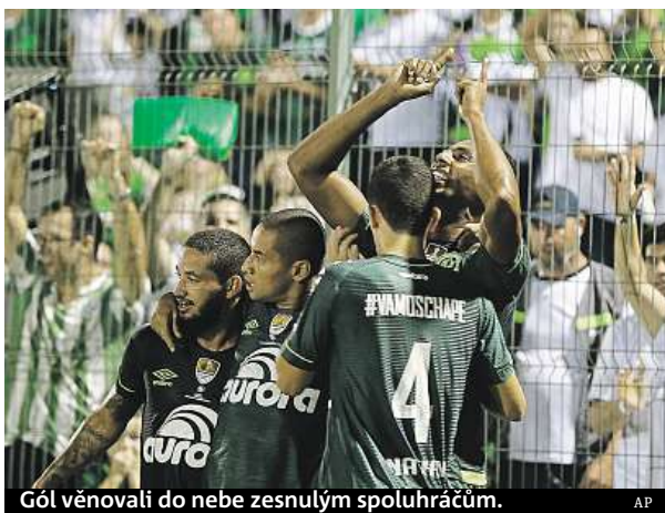
Gól věnovali do nebe zesnulým spoluhráčům.

Při pádu letadla s výpravou Chapecoense zahynulo 71 lidí včetně 19 fotbalistů. Přežili jen tři. Brazilci letěli do Kolumbie odehrát finále Jiho-