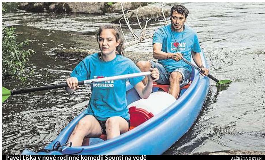
Pavel Liška v nové rodinné komedii Špunti na vodě

Aktuálně hrajeme úžasnou hru Už nikdy sám v Divadle Kalich a pak jsme s Bolkem Polívkou v jeho divadle po dvaceti letech oprášili Podivné odpoledne dr. Zvonka Burkeho. A ještě už od školy hrajeme představení Commedia dell'arte, které jsme si nazkoušeli na prázdniny, protože herci mají dva měsíce prázdnin, tak abychom to bez divadla přežili.