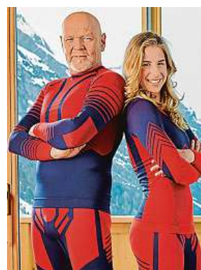
Image značky Lidl ovlivnilo i využití celé řady celebrit. LIDL.CZ