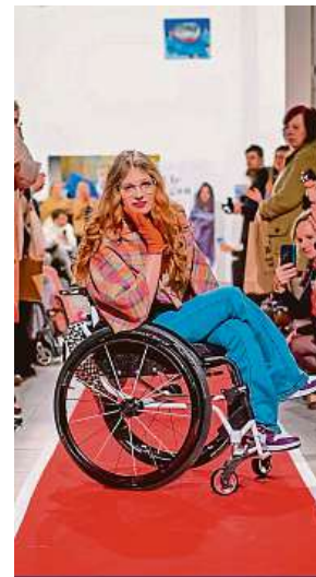
Charitativní módní přehlídka Každá jsme krásná je silná. CZEPA

Nejde přitom o bojové techniky, účastnice se seznámí s pěti základními principy sebeobrány, které staví na intuíci, komunikaci a prevenci. Workshop je vhodný pro ženy všech věkových skupin. Mohou přijít samy, s kamarádkou nebo například v duu matka – dcera. Uskuteční se na MDŽ v prostoru Yogame v Praze. Je to proto skvělá volba spojit příjemné s užiteč-