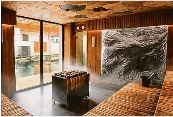
Wellness Horal nabízí pro ženy v neděli zvýhodněné ceny. HORAL

Sebeobrana, večer po italsku nebo film s popcornem v kině. Oslava žen se blíží a my víme, co je může potěšit.