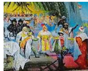
2x MUZEUM REKORDŮ