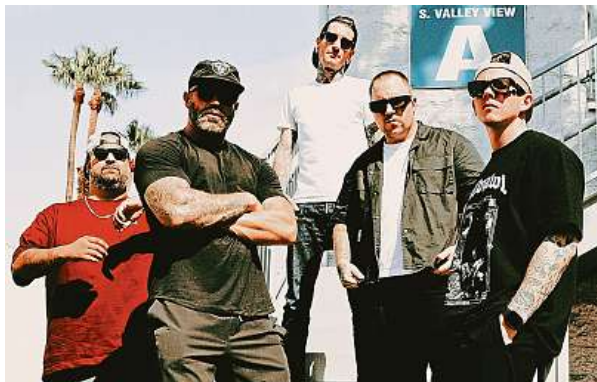
Dorazí i partička, která si říká Lionheart.

„Line-up jsme letos skládali s důrazem na žánrovou pestrost, od velkých ikon až po aktuální objevy,“ říká ředitel fes-