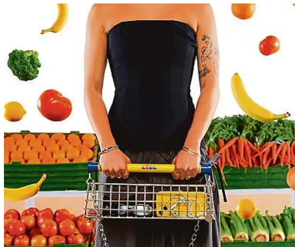
Designér Nik Bentel představil ve spolupráci s řetězcem marketů kabelku Trolley Bag ve tvaru nákupního vozíku. NIK BENTEL STUDIO