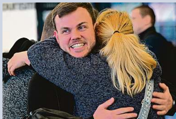
Na pražském letišti přistálo letadlo s českými turisty.

Na motocykl usedá stále více žen, a tak organizátoři z Veletrhů Brno letos na Motosalonu poprvé otevřeli Ladies zone. „Pro ženy je určená část pavilonu. A to jak pro ty, které s myšlenkou začít jezdit na motorce koketují, tak pro ty, které už jezdí,“ říká Petr Maliňák, manažer Motosalonu, který se v Brně koná do neděle.