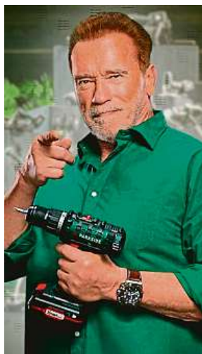
Arnold Schwarzenegger je ambasadorem značky Parksider.

Diskontní řetězec Lidl to dotáhl i na přehlídková mola. Status podobně ultralevné módní značky, ke které mají zákazníci silnou emocionální vazbu, má i Pepco, KiK či Primark.