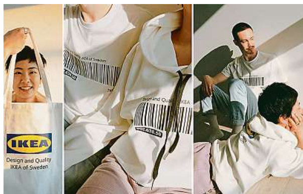
V Japonsku byla kolekce oblečení Ikea uvedena na trh v polovině roku 2020. Od 1. července 2021 byla v prodeji také v Česku. IKEA

Zjednodušeně řečeno, pokud chcete pro celou rodinu za pár stokorun pořídít oblečení například s obrázkem Batmana, je praktické vyrazit právě tam.