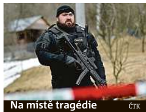
Na místě tragédie