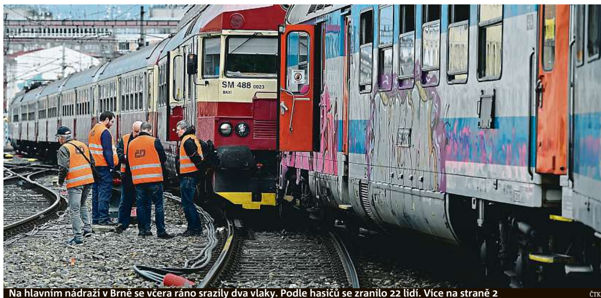
Na hlavním nádraží v Brně se včera ráno srazily dva vlaky. Podle hasičů se zranilo 22 lidí. Více na straně 2 ČTK

Padesát tisíc. Řemeslo má skutečně zlaté dno, schopní pracovníci dosáhnou na nadprůměrné platy. Mladí. Těžká manuální práce je přesto neláká. Kurzy. Nejen pro laiky, ale i pro řemeslníky z jiných oborů STRANA 4