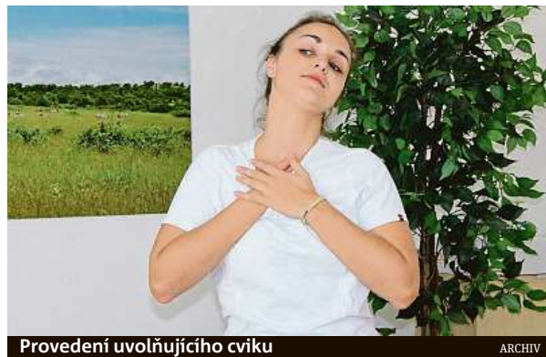
Provedení uvolňujícího cviku

Až 90 procent astmatiků pociťuje zúžení dýchacích cest při cvičení, a to především v zimním období. V teplejších měsících bývá astma způsobené plísňovými alergeny a pylovou sezónou. Ta trvá podle údajů pylového zpravodajství až deset měsíců v roce – začíná na jaře, kdy rozkvétají dřeviny, pokračuje v létě travinami a obilovinami a končí časným podzimem, kdy dominuje pyl bylin a spory plísní. „Dlouhodobé problémy dechových funkcí se mohou negativně projevit i na pohybové soustavě – místo hlavních dechových svalů začne postižený člověk víc používat takzvané svaly pomocné, čímž dojde k jejich přetěžování, vzniku svalových dysbalancí, kloubních blokád a k dalším neduhům. Negativní efekt však funguje i opačným směrem – patologie přítomná v oblasti pohybového aparátu škodí dechovým funkcím, například když blokáda žebra vede k bolestivému a neúplnému nádechu či výdechu,“ po-