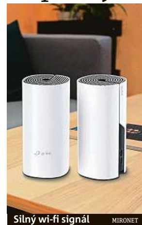
Silný wi-fi signál

rem vaše internetové připojení. Systém TP-Link Deco M4 vytváří dvoupásmové spojení o rychlosti až 1,2 Gbit/s. S hraním her i streamováním videa ve vysokém rozlišení tak nebudete mít nejmenší problém. Uživatel, který hledá router pro svoji rodinu s dětmi, nabízí Deco M4 pokročilou rodičovskou kontrolu. Rodič může například nastavit časové omezení pro připojení jednotlivých zařízení či sledovat jejich aktivitu na síti. Balíček dvou routerů TP-Link Deco M4 pořídíte v e-shopu Mironet za 3199 korun a nyní i s dopravou zdarma.