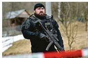
Na místě tragédie