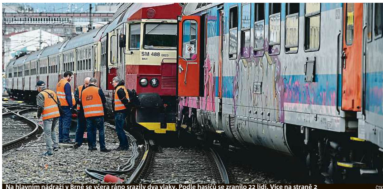
Na hlavním nádraží v Brně se včera ráno srazily dva vlaky. Podle hasičů se zranilo 22 lidí. Více na straně 2 ČTK

Padesát tisíc. Řemeslo má skutečně zlaté dno, schopní pracovníci dosáhnou na nadprůměrné platy. Mladí. Těžká manuální práce je přesto neláká. Kurzy. Nejen pro laiky, ale i pro řemeslníky z jiných oborů STRANA 4