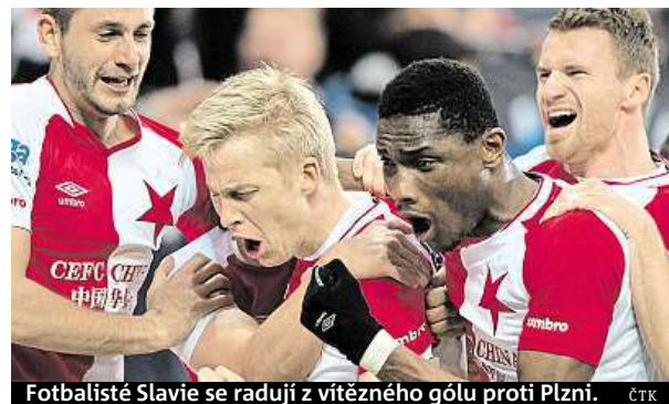
Fotbalisté Slavia se radují z vítězného gólu proti Plzni.

Klíčová bitva jara mezi Slavií a Plzní vyzněla lépe pro domácí. Vítězství 1:0 zařídil pražskému týmu v 88. minutě Frydrych. Viktorija dohrávala po vyloučení Řezníka posledních dvacet minut v deseti. Slavia tak po 19. kole vede tabulku první fotbalové ligy o čtyři body právě před Plzní.