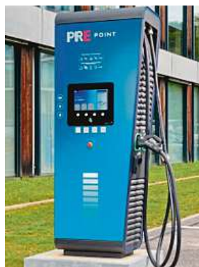
Dobíjecí stanice PRE

Provozovatel největší sítě společnost ČEZ loni zprovoznil 206 nových stojanů, celkově jich tak nyní má ve své síti téměř 1 000 s výkonem přes 100 megawattů (MW). Ve větší míře se přitom soustředila na rozšiřování ultrarychlých stanic, kterých otevřela 133. „Z poptávky řidičů jasně vyplývá, že preferují úsporu času díky ultrarychlému dobíjení. Právě tento typ stanic proto začíná v posledních letech mezi našimi instalacemi převažovat a dnes je každý pátý stojan naší sítě ultrarychlý,“ uvedl místopředseda představenstva ČEZ Pavel Cyran.