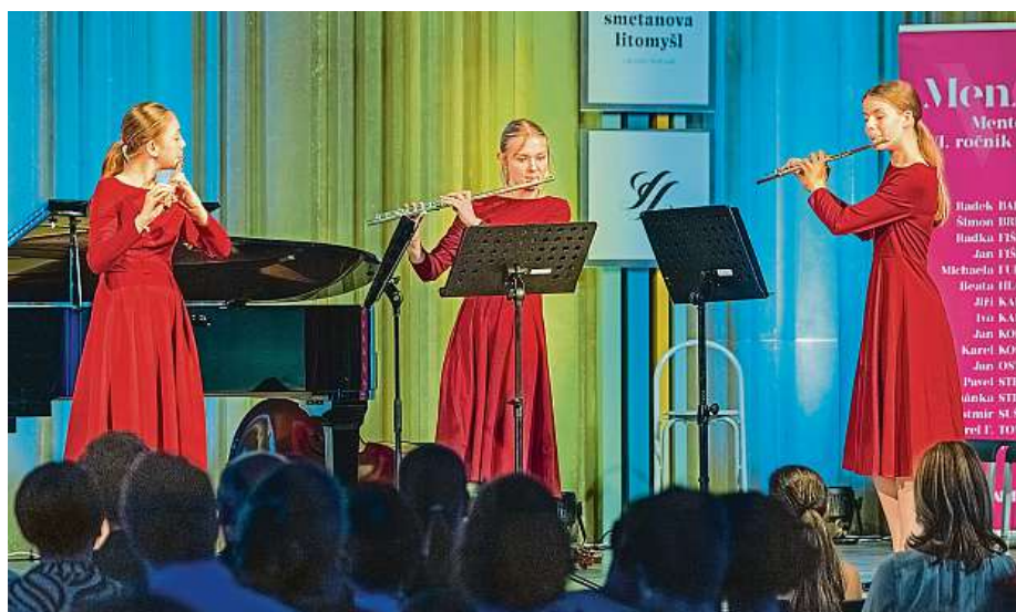
Absolventi dostávají pravidelně prostor na festivalu Smetanova Litomyšl.

Akademie MenART dává mladým umělcům možnost zažít to, který může zásadně ovlivnit jejich další směřování – profesní i lidské. MET