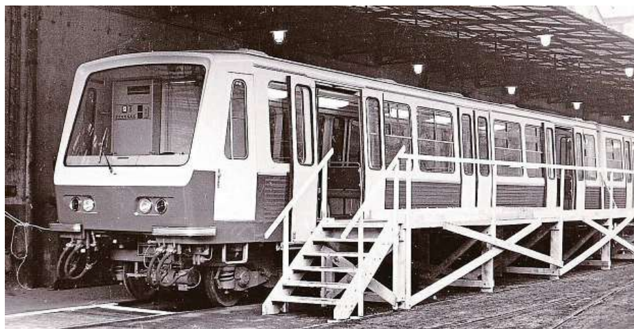
Dokončená jednotka R1 vystavená na dvoře smíchovského závodu

Už v době, kdy probíhaly jízdní zkoušky československých souprav, bylo nicméně jasné, že pražské podzemí jim nikdy patřit nebude. Tlak ze SSSR přiměl komunistické úřady ke změně, která je v pražském podzemí vidět dodnes. Konec jednotek R1