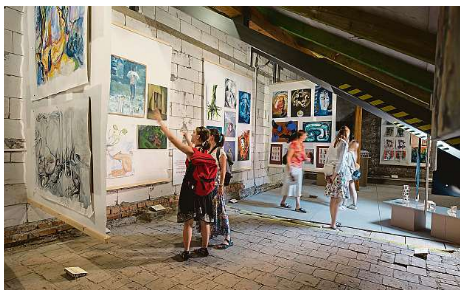
Mladí umělci se představí i na výstavě Na cestě.