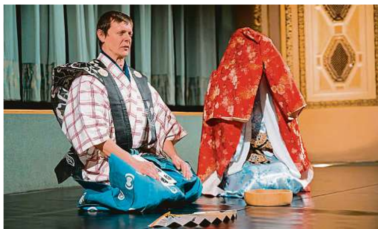
Japonský kjógen představuje komickou divadelní formu.