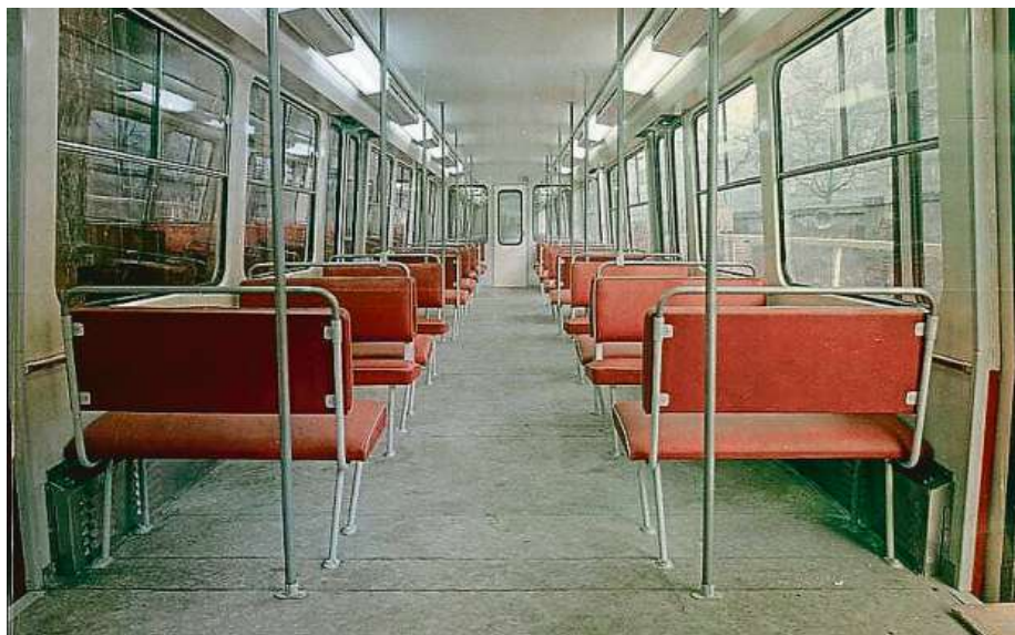
Interiér prototypové jednotky R1