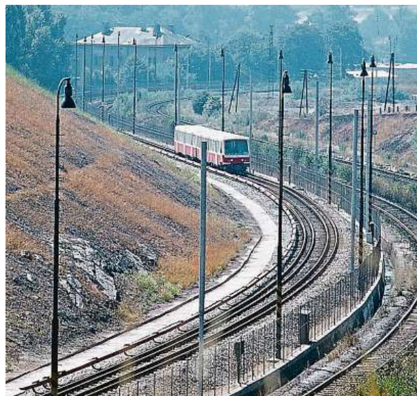
Prototypová R1 na zkušební dráze kačerovského depa