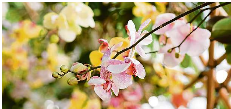
Výstava představí bohatou kolekci orchidejí ze sbírek botanické zahrady i od dalších pěstitelů. BZHMP

Výstava ve skleníku Fata Morgana představí bohatou kolekci orchidejí ze sbírek botanické zahrady i od dalších pěstitelů. Pro střednětým tematických panelů se zájemci seznámí s osobnostmi, které stály za objevy těchto rostlin, a dozví se, jak se orchideje dostávaly do Evropy a k českým pěstitelům. O víkendech se uskuteční workshopy, kde