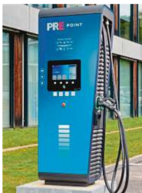
Dobíjecí stanice PRE

Provozovatel největší sítě společnost ČEZ loni zprovoznil 206 nových stojanů, celkově jich tak nyní má ve své síti téměř 1 000 s výkonem přes 100 megawattů (MW). Ve větší míře se přitom soustředila na rozšiřování ultrarychlých stanic, kterých otevřela 133. „Z poptávky řidičů jasně vyplývá, že preferují úsporu času díky ultrarychlému dobíjení. Právě tento typ stanic proto začíná v posledních letech mezi našimi instalacemi převažovat a dnes je každý pátý stojan naší sítě ultrarychlý,“ uvedl místopředseda představenstva ČEZ Pavel Cyran.