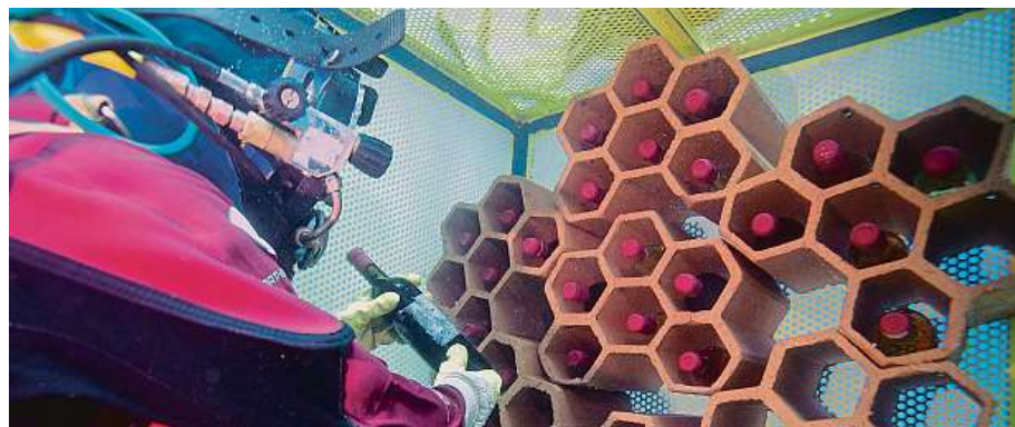
Dno moře nabízí stabilní teplotu kolem, což je pro zrání velmi příznivé.