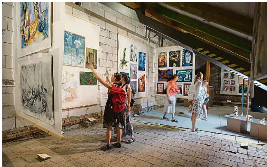
Mladí umělci se představí i na výstavě Na cestě.