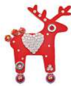
Brož Deers Olga Menzelová 990 Kč