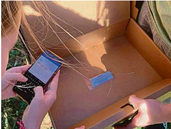
Minulé ročníky byly plné adrenalinu a úkolů.