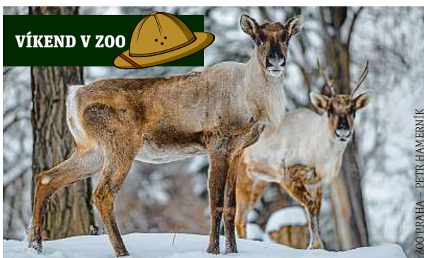
VÍKEND V ZOO