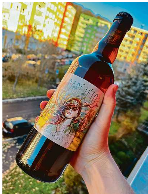
Babi léto hraje všemi barvami.