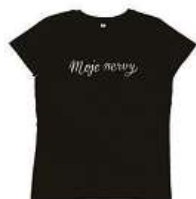
Tričko Moje nervy Dva tátové 450 Kč