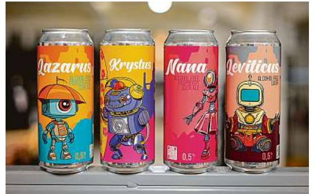
Na etiketách pivovaru Clock hrají prim roboti. PIVOVAR CLOCK

Pivovarů jsou stovky, piv tisíců. Když zákazník dorazí do pivovárky, stojí proto před paletou možností. Cím může design zaujmout? „Dobře fungují zářivé barvy, zajímavé