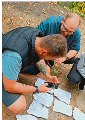
A co vy? Zúčastníte se této mafiánské hry?

Mafii považujeme za dobrou alternativu trávení volného času. Nejedná se totiž o další virtuální svět, jenž by postrádal reálné prožitky. Základem jsou skuteční lidé, papí-