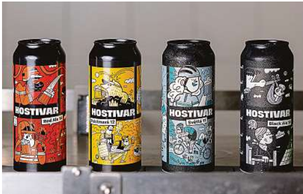
Pivovar Hostivar náměty čerpá ze sousedských setkání.