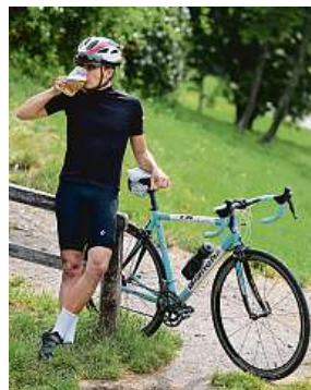
Nealko piva se prosadila hlavně u sportovců.

Trendu umírněnější konzumace alkoholu u mladších generací se snaží čelit také výrobci nápojů. Především pivovary, pro které nenacházejí uvedené věkové kategorie pochopení jako skalní pivaři. Proto se například i v období, které se v Česku již dlouhodo-