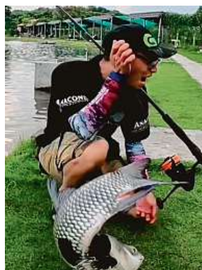
Šon s kaprem siamským. Ten rybáři dal co proto.