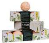
Koupelové koule Manufaktura 200 Kč