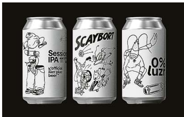
Pivo Board tvoří design a ilustrace P. Kudláček a J. Kúrka. @UNCLEPOMPO