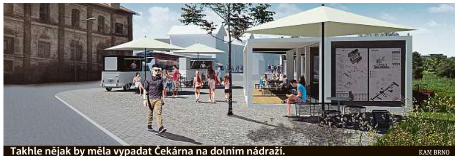
Takhle nějak by měla vypadat Čekárna na dolním nádraží.