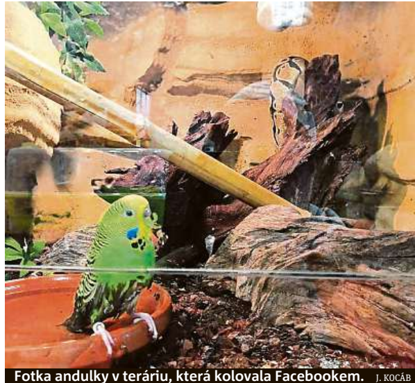
Fotka andulky v teráriu, která kolovala Facebookem.