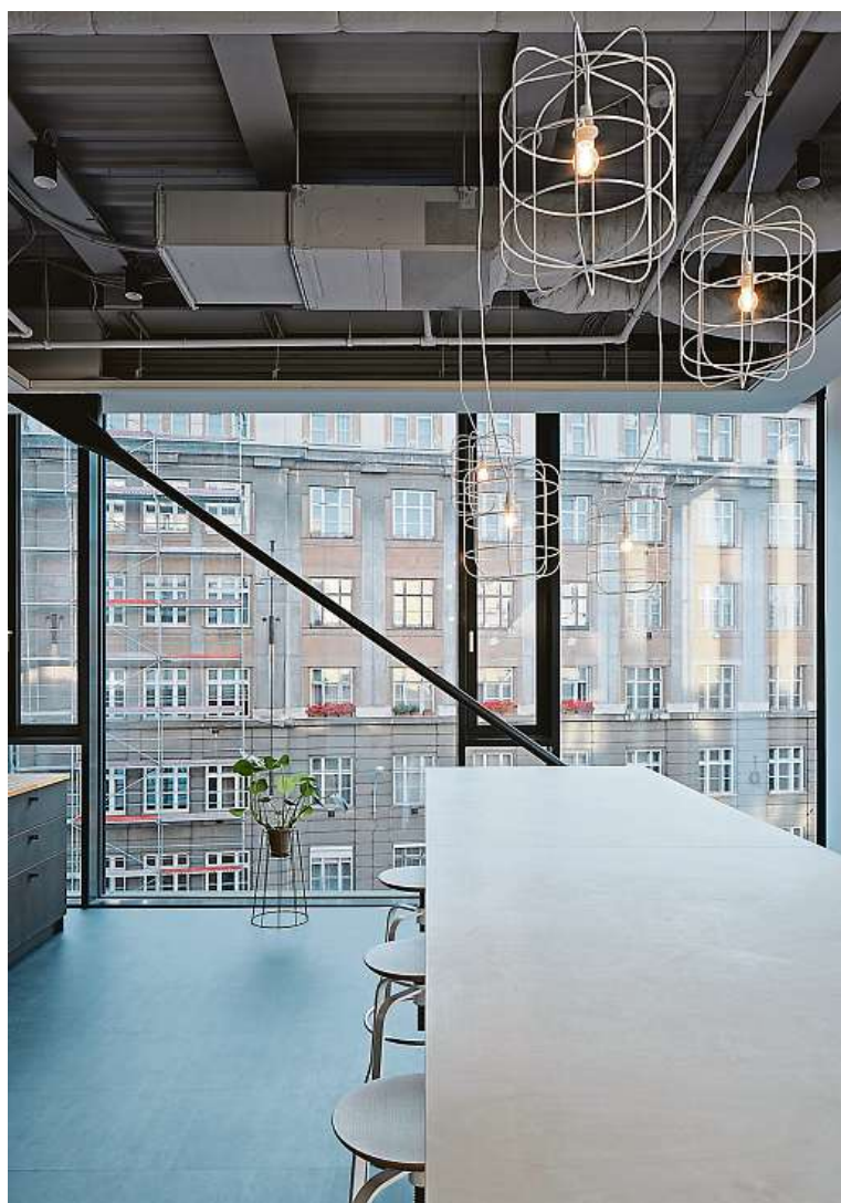
Kanceláře v Rozmarýnu zaujmou hned na první pohled.