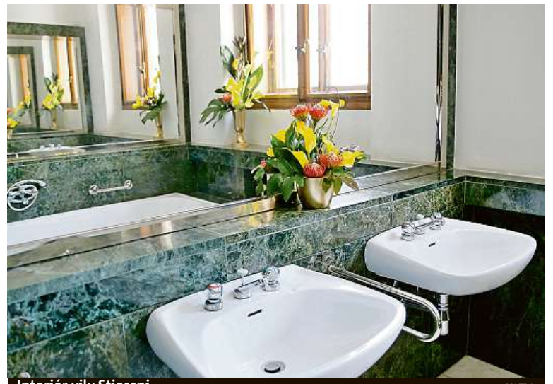
Interiér vily Stiassni