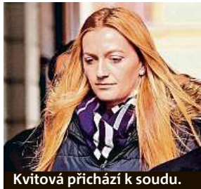
Kvitová přichází k soudu.

Žondra tvrdí, že v bytě Kvitové vůbec nebyl. „Ve výpovědi poškozené je řada nesrovnalostí. Například jak se dostaly krvavé stopy do koupel-