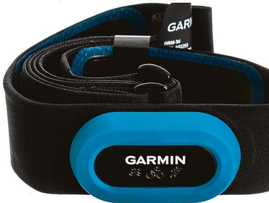
Chytrý snímač tepové frekvence

Kvalitu tohoto hrudního pásu potvrzují sami sportovci, kteří z něj podle dostupných prodejních dat rychle udělali bestseller a nešetří pochvalnými recenzemi. Garmin HRM-Tri můžete nyní výhodně pořídit v internetovém obchodě Mironet se slevou 34 procent – za 2399 korun.