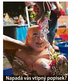
Napadá vás vtipný popisek?

Napište bublinu a reagujte na sloupek na: www.facebook.com/denikmetro