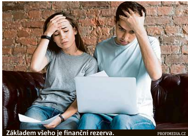
Základem všeho je finanční rezerva.