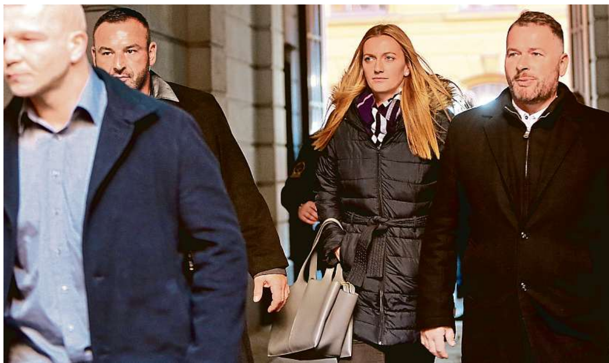
„Křičela jsem, všude byla spousta krve.“ Petra Kvitová vypovídala u soudu o napadení z prosince 2016. Více na straně 4

Krajánci. Stále více lidí pracuje v zahraničí, mají také stále vyšší platy. Od sousedů. Padesát procent peněz, které z ciziny putují na české účty, pochází z Německa. Cizinci. V Česku si nejvíc vydělávají Ukrajinci STRANA 2