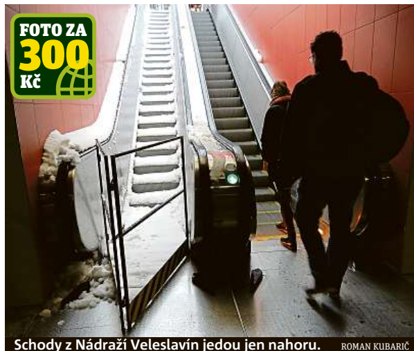
Schody z Nádraží Veleslavin jedou jen nahoru. ROMAN KUBARIČ

Schody jsou mimo provoz v metru na Malostranské, Můstku i na Nádraží Veleslavin.