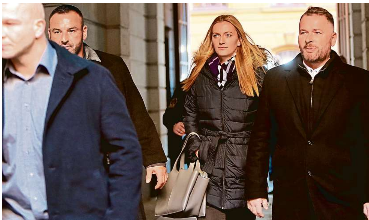
„Křičela jsem, všude byla spousta krve.“ Petra Kvitová vypovídala u soudu o napadení z prosince 2016. Více na straně 8

Krajánci. Stále více lidí pracuje v zahraničí, mají také stále vyšší platy. Od sousedů. Padesát procent peněz, které z ciziny putují na české účty, pochází z Německa. Cizinci. V Česku si nejvíc vydělávají Ukrajinci STRANA 6