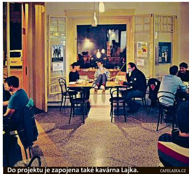
Do projektu je zapojena také kavárna Lajka.

Akce probíhá za podpory Pražských služeb a městské části Praha 7. „Za největší úspěch bych považoval, kdyby projekt zvedl vlnu, na kterou budou naskakovat i další kavárny u nás i jinde,“ nastiňuje vizi Ondřej Kolínský z Prahy 7. ANNA PORTEŠOVÁ