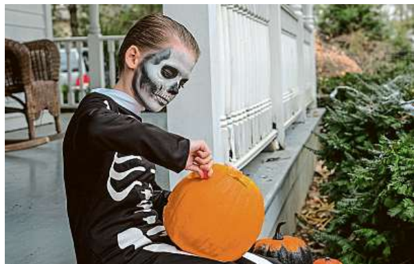
Taylor Schilling v roli tajemného chlapce

Chcete se bát? Nevyzpytatelné chování malého Milse je ústředním motivem hororového Potomka s Taylorem Schillingem v hlavní roli. Ve stejnou dobu, jako přišel na svět malý Miles, se na jiném místě odehrála tragédie. Dvě zdánlivě nesouvisející události se za několik let propojí děsivým způsobem. MET