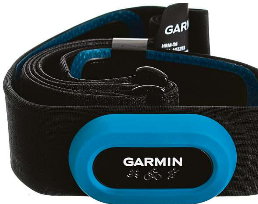
Chytrý snímač tepové frekvence

Kvalitu tohoto hrudního pásu potvrzují sami sportovci, kteří z něj podle dostupných prodejních dat rychle udělali bestseller a nešetří pochvalnými recenzemi. Garmin HRM-Tri můžete nyní výhodně pořídit v internetovém obchodě Mironet se slevou 34 procent – za 2399 korun.