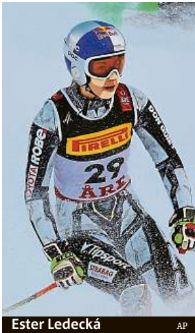
Ester Ledecká

Olympijský zázrak se neopakoval. Česká závodnice ve třetí desítce.