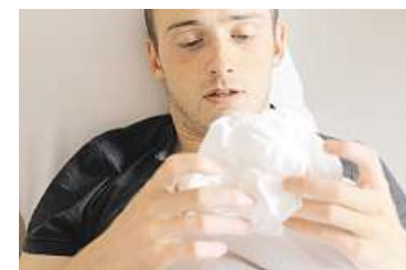
S chřipkou do postele

ka nasadit, pomáhá lékařům rychlé vyšetření měření hladiny bílkoviny označované jako CRP. Z kapky krve, která se odebírá z prstu, dokáže lékař přímo v ordinaci během pár minut zjistit, zda se jedná spíše o virovou, či bakteriální infekci. Pokud je hladina nízká – 6 až 40 mg/l, jde o viry. Je-li hodnota vyšší než 40 mg/l, pak jde pravděpodobně o bakterii – a pak má nasazení antibiotik význam. U nízkého CRP nikoli. Nemoc se velmi dobře přenáší dvěma způsoby: vdechnutím