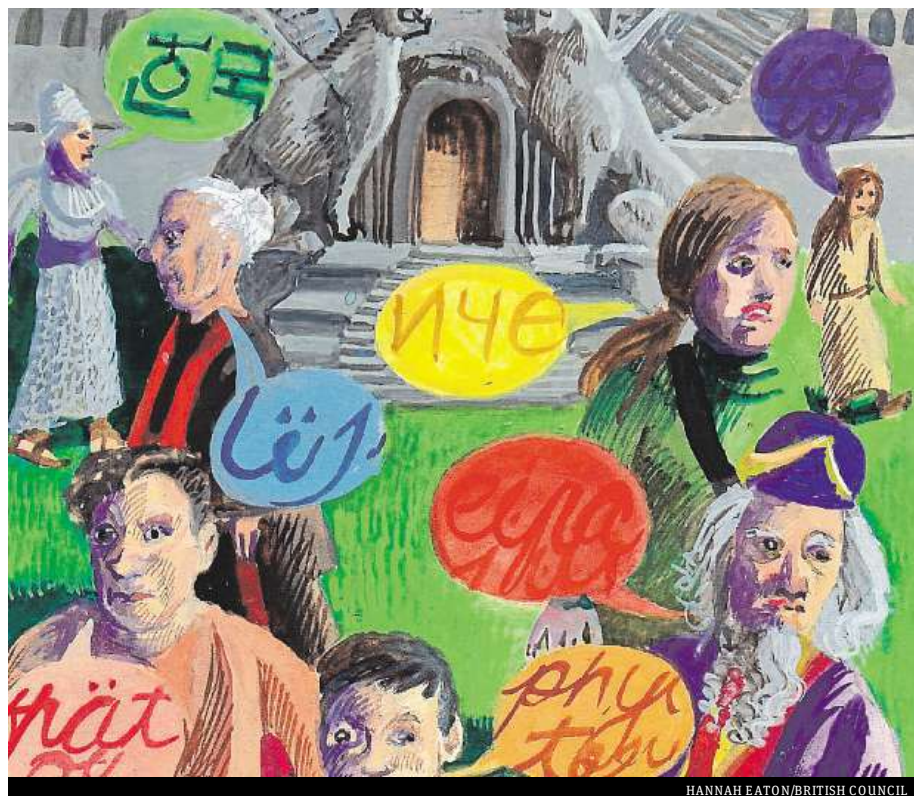
HANNAH EATON/BRITISH COUNCIL

In this series you will learn about myths and legends from various parts of the world.