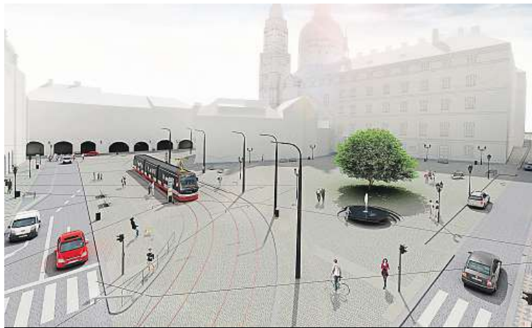
Rekonstrukce náměstí má dostat stavební povolení na konci května. MHMP

Budoucí podoba Malostranského náměstí počítá s žulou, kašnou, ale jen pěti stromy.