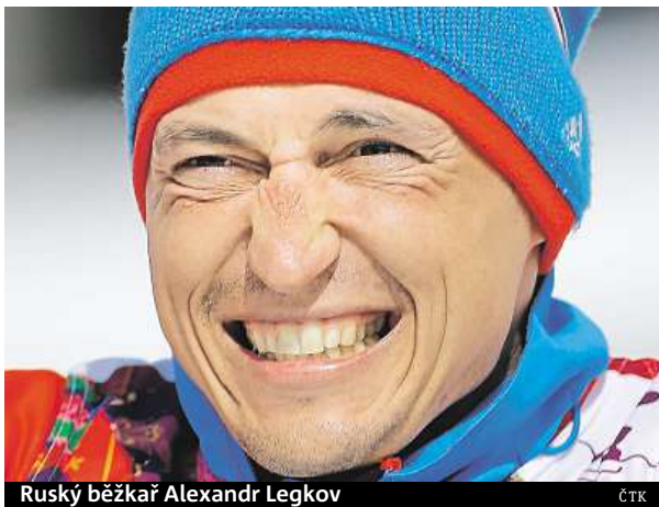
Ruský běžkař Alexandr Legkov

Patnáct z nich včetně běžce na lyžích Alexandra Legkova, skeletonisty Alexandra Tretjakova nebo rychlobruslařky Olgy Fatkulinové pak požádalo o dodatečnou nominaci. Komise pod vedením bývalé francouzské ministryně sportu Valérie Fourneyronové jejich pří-