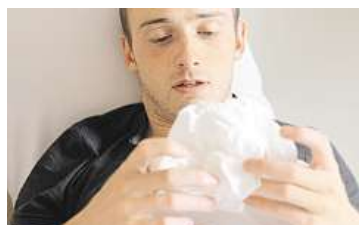
S chřipkou do postele PROFIMEDIA.CZ

ka nasadit, pomáhá lékařům rychlé vyšetření měření hladiny bílkoviny označované jako CRP. Z kapky krve, která se odebírá z prstu, dokáže lékař přímo v ordinaci během pár minut zjistit, zda se jedná spíše o virovou, či bakteriální infekci. Pokud je hladina nízká – 6 až 40 mg/l, jde o viry. Je-li hodnota vyšší než 40 mg/l, pak jde pravděpodobně o bakterii – a pak má nasazení antibiotik význam. U nízkého CRP nikoli. Nemoc se velmi dobře přenáší dvěma způsoby: vdechnutím