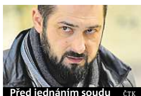
Před jednáním soudu