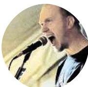
Jan Tesař Vizovické kapky. Nejlepší lék.