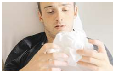
S chřipkou do postele

ka nasadit, pomáhá lékařům rychlé vyšetření měření hladiny bílkoviny označované jako CRP. Z kapky krve, která se odebírá z prstu, dokáže lékař přímo v ordinaci během pár minut zjistit, zda se jedná spíše o virovou, či bakteriální infekci. Pokud je hladina nízká – 6 až 40 mg/l, jde o viry. Je-li hodnota vyšší než 40 mg/l, pak jde pravděpodobně o bakterii – a pak má nasazení antibiotik význam. U nízkého CRP nikoli. Nemoc se velmi dobře přenáší dvěma způsoby: vdechnutím