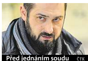
Před jednáním soudu