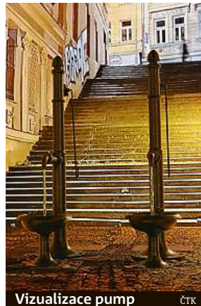
Vizualizace pump

Jednoduchost návrhu ocenil předseda výboru pro územní rozvoj Prahy 3 Matěj Michal Žaloudek. „Zároveň je to dílo provokativní