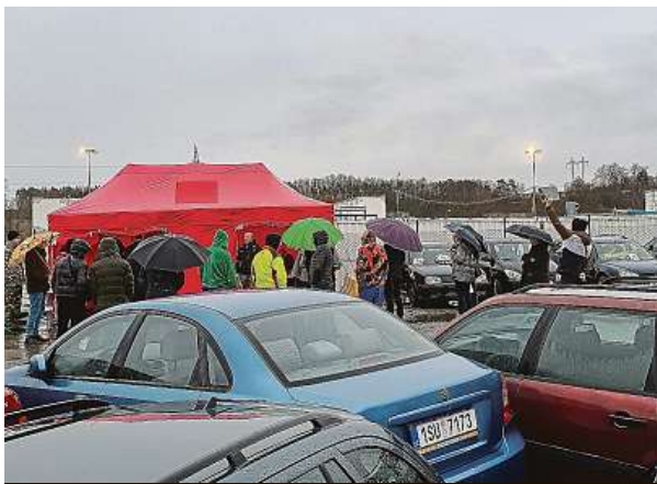
Na parkovišti v Dubči si mohli zájemci za pár stokorun pořídit škodovku nebo třeba passata.