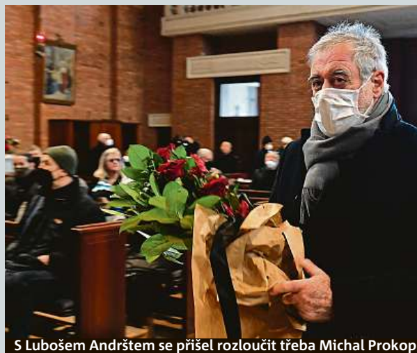
S Lubošem Andrštem se přišel rozloučit třeba Michal Prokop nebo Petr Janda.

Rodina i muzikanti se v pražském kostele Nejsvětějšího Srdce Páně rozloučili s bluesmanem Lubošem Andrštem. Uznávaného kytaristu a skladatele na poslední cestě doprovodila stovka lidí. Andršt zemřel 20. prosince ve věku 73 let. idnes.cz