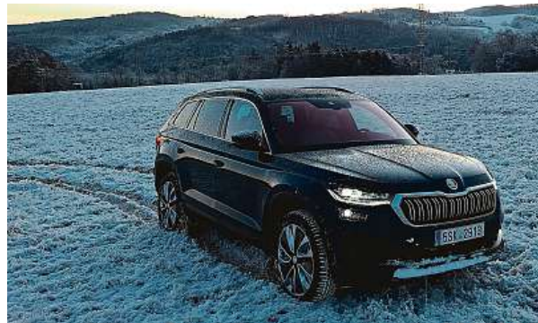
Na klzkém povrchu se s Kodiaqem neztratíte.

Ideál pro rodinu, která si však připlatí. Cena startuje na 860 tisících, ale za čtyřkolku se silnějším dieselem, skvělými světly a výbavou chce Škoda přes milion. Ale zaslouženě. PETR HOLEČEK