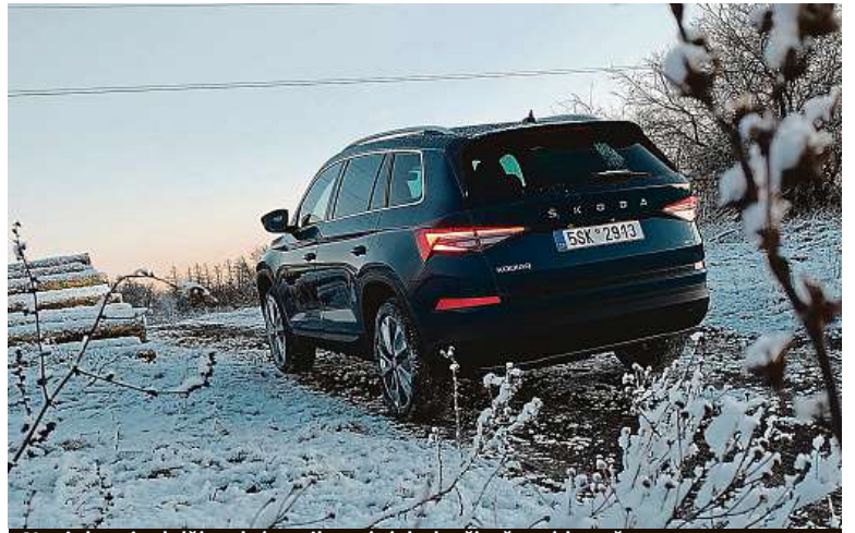
Novinkou je delší zadní spoiler pátých dveří v černé barvě.