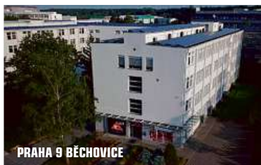
PRAHA 9 BĚCHOVICE

Jsme česko-belgická firma a na trhu působíme již od roku 1994. Naší hlavní činností je import karosářských dílů a vybavení pro MOTO.