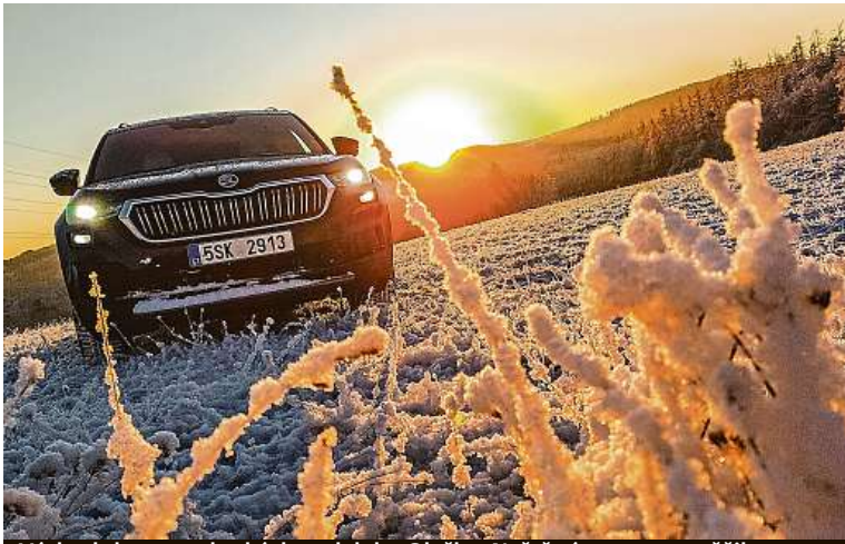
Východ slunce na loukách nedaleko Oleška. Naštěstí na test zasněžilo...