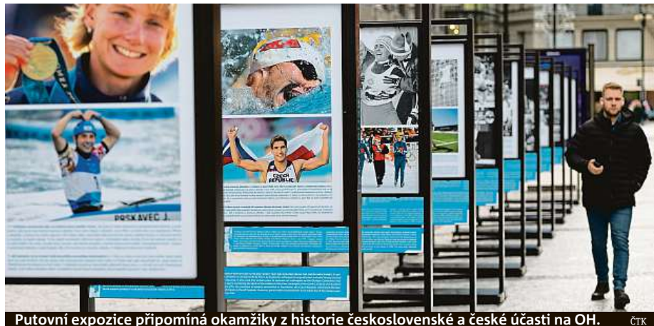
Putovní expozice připomíná okamžiky z historie československé a české účasti na OH.

Okamžiky významné pro český sport jsou k vidění v ulici Na Příkopě v Praze.