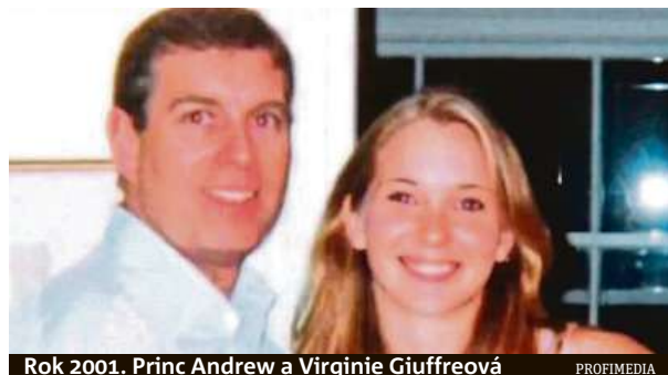
Rok 2001. Princ Andrew a Virginie Giuffreová

„Andrew mě sexuálně napadl v roce 2001.“ Tak zní obvinění Američanky Virginie Giuffreové vůči britskému princ Andrewovi. Tomu bylo v době údajného incidentu 41 let, Giuffreové teprve 17.