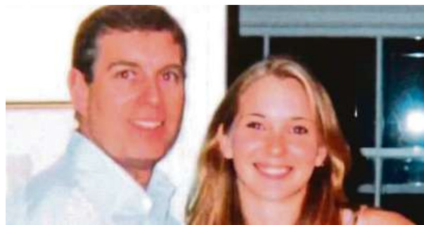
Rok 2001. Princ Andrew a Virginie Giuffreová

„Andrew mě sexuálně napadl v roce 2001.“ Tak zní obvinění Američanky Virginie Giuffreové vůči britskému princovi Andrewovi. Tomu bylo v době údajného incidentu 41 let, Giuffreové teprve 17.