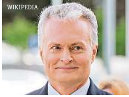
Litevský prezident Gitanas Nausėda se vložil do diplomatické roztržky s Čínou.

• Prezident se nechal slyšet, že loňské otevření diplomatické kanceláře Tchaj-wanu ve Vilniusu, jež popudilo Peking, je rozporuplné.