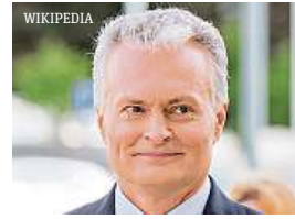
Litevský prezident Gitanas Nausėda se vložil do diplomatické roztržky s Čínou.

• Prezident se nechal slyšet, že loňské otevření diplomatické kanceláře Tchaj-wanu ve Vilniusu, jež popudilo Peking, je rozporuplné.