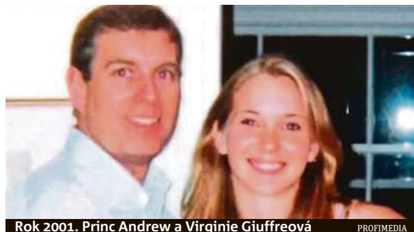
Rok 2001. Princ Andrew a Virginie Giuffreová

„Andrew mě sexuálně napadl v roce 2001.“ Tak zní obvinění Američanky Virginie Giuffreové vůči britskému princovi Andrewovi. Tomu bylo v době údajného incidentu 41 let, Giuffreové teprve 17.