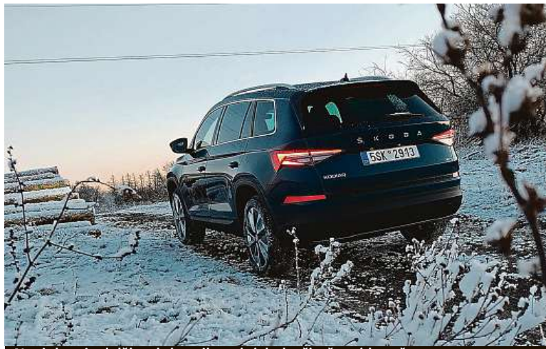
Novinkou je delší zadní spoiler pátých dveří v černé barvě.