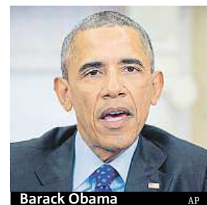
Barack Obama

Na trestní minulost zájemců o koupi střelných zbraní se podle současného zákona musí ptát jenom obchodníci s příslušnou federální licenci. Mnoho lidí, kteří prodávají zbraně na veletrzích, přes internet nebo na bleších trzích, ale příslušné povolení nemá. Tato díra v zákoně podle stoupenců přísnější kontroly držení zbraní slouží k tomu, aby se požadavek na prověření trest-