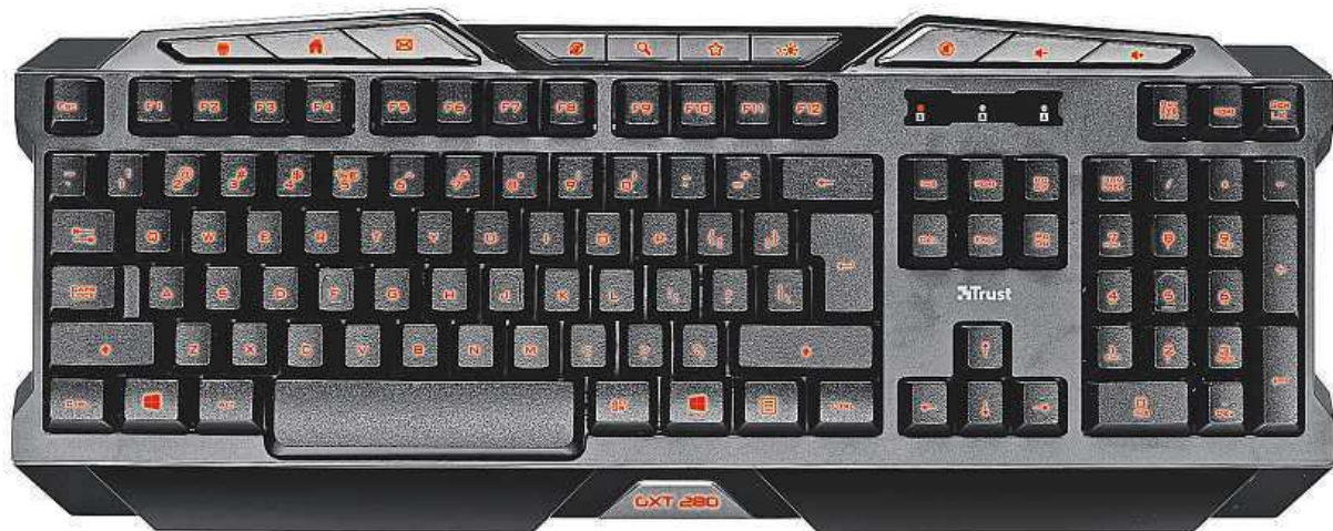
Podsvícená herní klávesnice s možností volby ze 3 barev a přizpůsobitelnou intenzitou podsvícení

Každý, kdo to myslí s hraním počítačových her alespoň trochu vážně nebo si jen rád při hraní dopřává pohodlí, ví, že bez pořádného příslušenství se prostě neobejde. Výrobci takovýchto doplňků obvykle hráče oddělují od ostatních uživatelů do samostatné kategorie, které potom servírují vybavení šité přímo na míru jejich potřebám. Výrobce, který na „gejmry“, jak si hráči mezi sebou hovorově říkají, myslí v první řadě, je společnost Trust. Z pestré palety