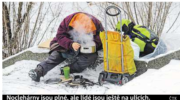
Noclehárny jsou plné, ale lidé jsou ještě na ulicích.