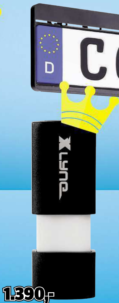
USB flash disk XLYNE WAVE, 128 GB, USB 3.0

Zasunovací USB konektor. Rychlost zápisu 9 MB/s. Rychlost čtení 70 MB/s.