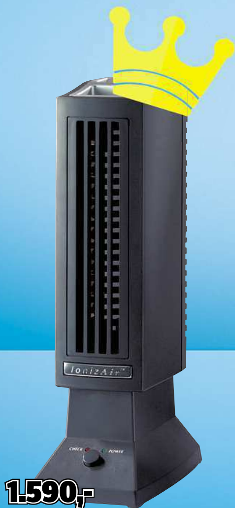
Ionizátor vzduchu P3 International IonizAir, P4620, 1,5 W

Nejprodávanější výrobky za výprodejové ceny!