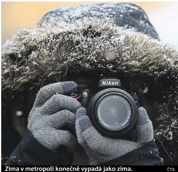
Zima v metropoli konečně vypadá jako zima.

Včera ráno po páté hodině už byl připraven na svém úseku v Liberijské ulici a jejím okolí, s sebou erární koště a lopatu. Úkol sněhové pohotovosti je jasný – do deseti hodin uklidit chodník od sněhu. Největším nepřítelem brigádníků podle něj není ani tak zima, na kterou se dá připravit teplým oblečením, ale špatně zaparkovaná auta.