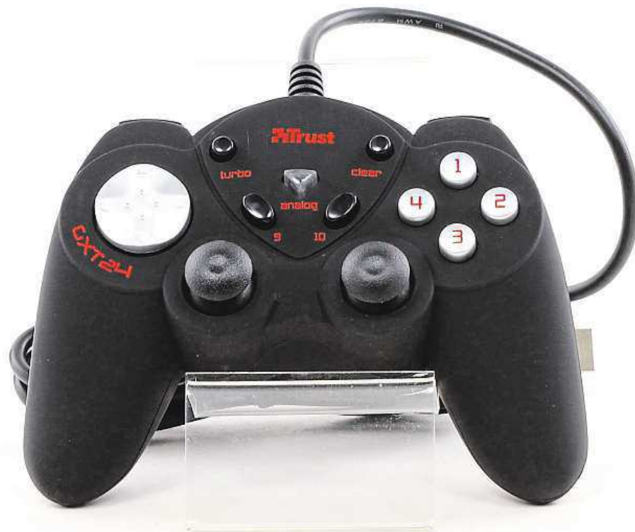
Není potřeba instalace, ovladač jednoduše propojíte s počítačem USB portem.

Zcela určitě potěší i fakt, že k instalaci není zapotřebí žádný software ani složitá a leckdy zdoluhavá instalace jakýchkoli dalších doplňků. Ovladač jednoduše propojíte s počítačem prostřed-