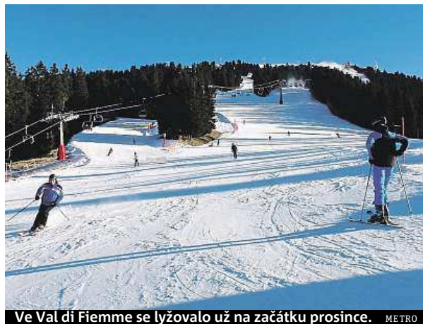
Ve Val di Fiemme se lyžovalo už na začátku prosince.

A že je Val di Fiemme oblast skutečně sportu zaslíbená, dokazují i areály klasického lyžování. Skvěle upravené tratě vás budou čekat třeba v průsmyku Passo Lavazé nad Cavalese.