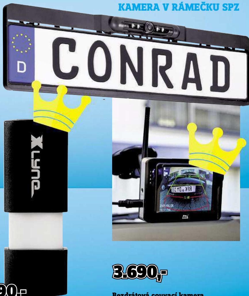
KAMERA V RÁMEČKU SPZ