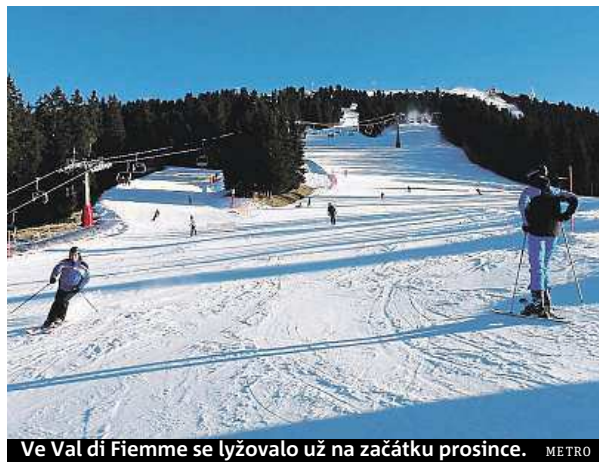
Ve Val di Fiemme se lyžovalo už na začátku prosince.

A že je Val di Fiemme oblast skutečně sportu zaslíbená, dokazují i areály klasického lyžování. Skvěle upravené tratě vás budou čekat třeba v průsmyku Passo Lavazé nad Cavalese.