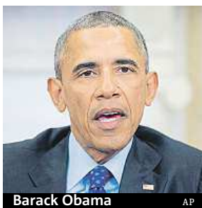
Barack Obama

Vláda Baracka Obamy požaduje, aby všichni prodejci zbraní museli zjišťovat, zda jejich klienti nemají záznam v trestním rejstříku. Toto opatření zpřísnující podmínky prodeje střelných zbraní je součástí Obamova balíku legislativních úprav. S jeho pomocí hodlá omezit násilnou činnost související s držením zbraní.