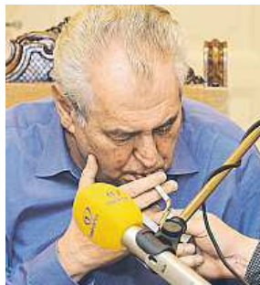
Zeman pro Frekvenci 1

Priznivý ohlas měly Zemanovy výroky v ruském parlamentu. Zeman označil ukrajinského premiéra Arsenije Jaceňuka za „premiéra války“, který nestojí o mírové řešení navrhované Evropou. Loňské svržení prezidenta Viktora Janukovyče pak Zeman nepovažuje za demokratickou revoluci. Nedávny kyjevský pochod k výročí narození kontroverzního ukrajinského vůdce Stepana Bandery přirovnal český prezident k nacistickým pochodňovým průvodům. Velvyslanectví Ukrajiny v Praze pak na Ze-