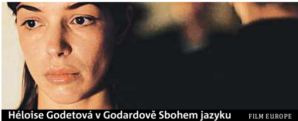
Héloïse Godetová v Godardově Sbohem jazyku

Nejlépeším filmem loňského roku byl podle americké Národní společnosti filmových kritiků experimentální 3D snímek klasika francouzské kinematografie Jeana-Luca Godarda s názvem Sbohem jazyku. Ten v hlasování filmových odborníků jen velmi těsně – o jeden hlas – porazil dra-