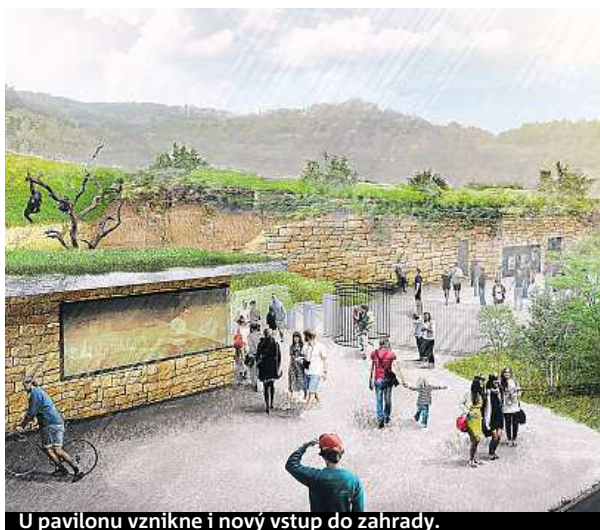
U pavilonu vznikne i nový vstup do zahrady.