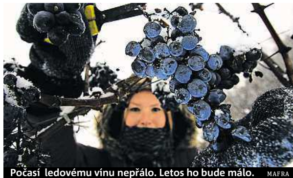
Počasí ledovému vínu nepřálo. Letos ho bude málo.

O sladký nápoj neusilovali ani v Popicích. „O ledovém víně jsem vůbec neuvažoval, kvůli špatnému počasí to nemělo cenu. Kdo ale na něj vsadil, ten bude mít letos vzá-