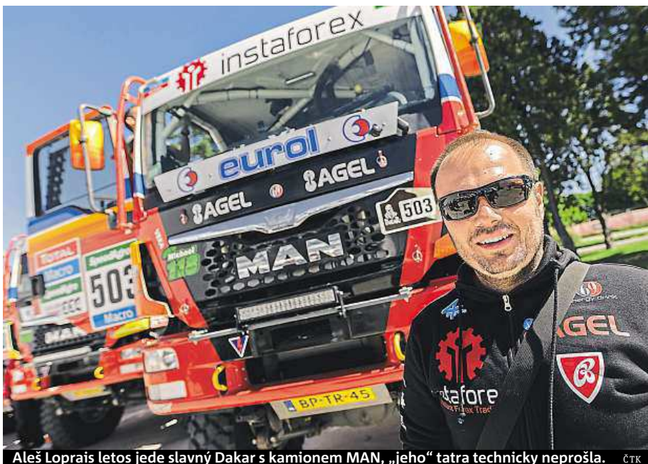
Aleš Loprais letos jede slavný Dakar s kamionem MAN, „jeho“ tatra technicky neprošla.

„Riskuji tady vše pro touhu něco dosáhnout a splnit si sen,“ řekl závodník. Na motocykly čeká celkem 9295 km, z toho 4752 měřených.