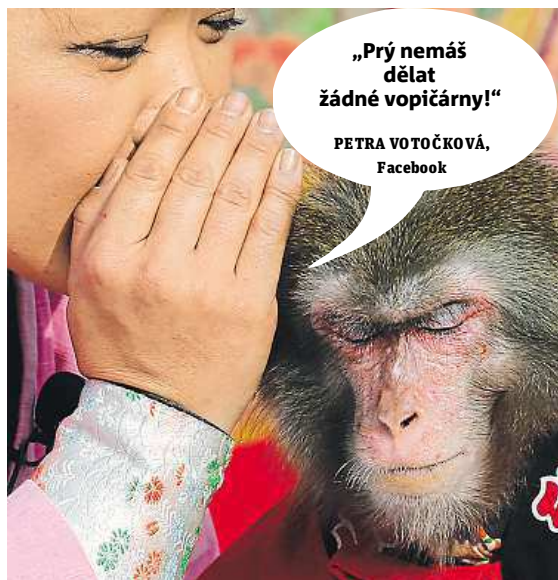
PETRA VO TOČKOVÁ, Facebook

Napište bublinu a reagujte na sloupek na: www.facebook.com/denikmetro