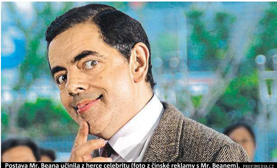
Postava Mr. Beana učinila z herce celebrity (foto z čínské reklamy s Mr. Beanem).

V osmdesátých letech se svým spolužákem z Oxfordu Richardem Curtisem vymyslel situační komedii Černá zmije založenou na svérázném výkladu britských dějin. Hlavně však spolu stvořili postavu pana Beana. Beanománii odstartoval již první díl ze série příběhů o trampotách svobodného mládence z roku 1990. Nešika s legračně vykulenými očima, opelichaným medvídkem a spoustou ztřeš-