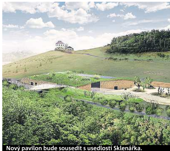
Nový pavilon bude sousedit s usedlostí Sklenářka.