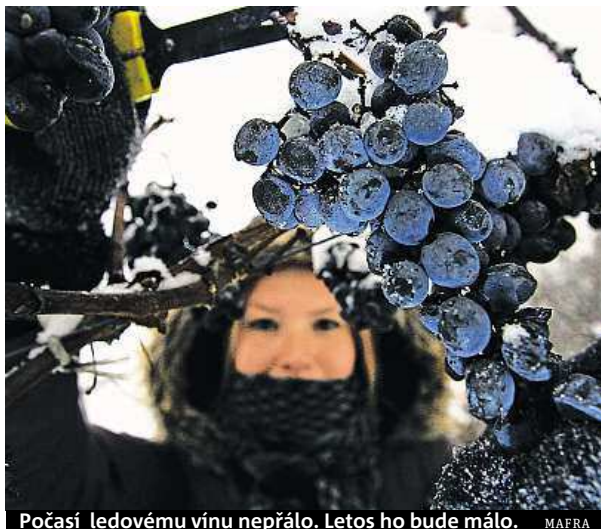
Počasí ledovému vínu nepřálo. Letos ho bude málo.