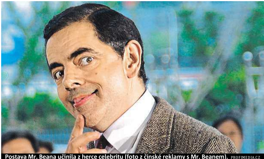
Postava Mr. Beana učinila z herce celebrity (foto z čínské reklamy s Mr. Beanem).

V osmdesátých letech se svým spolužákem z Oxfordu Richardem Curtisem vymyslel situační komedii Černá zmije založenou na svérázném výkladu britských dějin. Hlavně však spolu stvořili postavu pana Beana. Beanománii odstartoval již první díl ze série příběhů o trampotách svobodného mládence z roku 1990. Nešika s legračně vykulenými očima, opelichaným medvídkem a spoustou ztrěs-