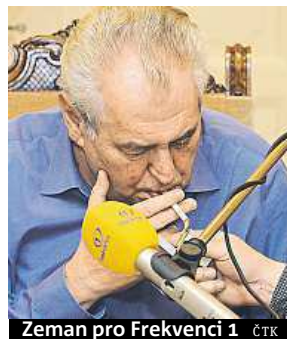
Zeman pro Frekvenci 1

Příznivý ohlas měly Zemanovy výroky v ruském parlamentu. Zeman označil ukrajinského premiéra Arsenije Jaceňuka za „premiéra války“, který nestojí o mírové řešení navrhované Evropou. Loňské svržení prezidenta Viktora Janukovyče pak Zeman nepovažuje za demokratickou revoluci. Nedávný kyjevský pochod k výročí narození kontroverzního ukrajinského vůdce Stepana Bandery přirovnal český prezident k nacistickým pochodňovým průvodům. Velvyslanectví Ukrajiny v Praze pak na Ze-