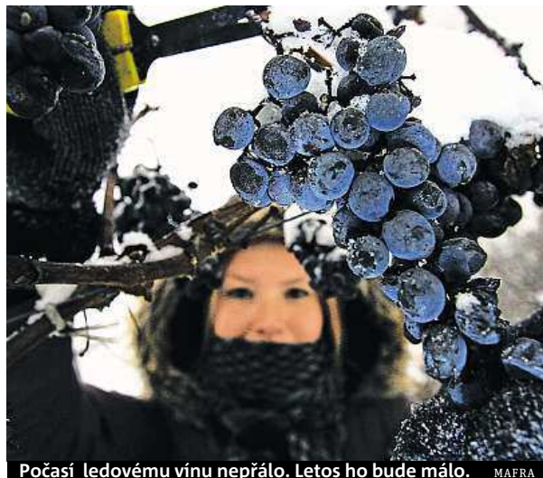
Počasí ledovému vínu nepřálo. Letos ho bude málo.