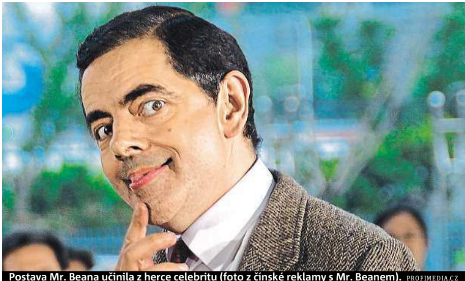
Postava Mr. Beana učinila z herce celebritu (foto z čínské reklamy s Mr. Beanem).

V osmdesátých letech se svým spolužákem z Oxfordu Richardem Curtisem vymyslel situační komedii Černá zmije založenou na svérázném výkladu britských dějin. Hlavně však spolu stvořili postavu pana Beana. Beanománii odstartoval již první díl ze série příběhů o trampotách svobodného mládence z roku 1990. Nešika s legračně vykulenými očima, opelichaným medvídkem a spoustou ztrěs-