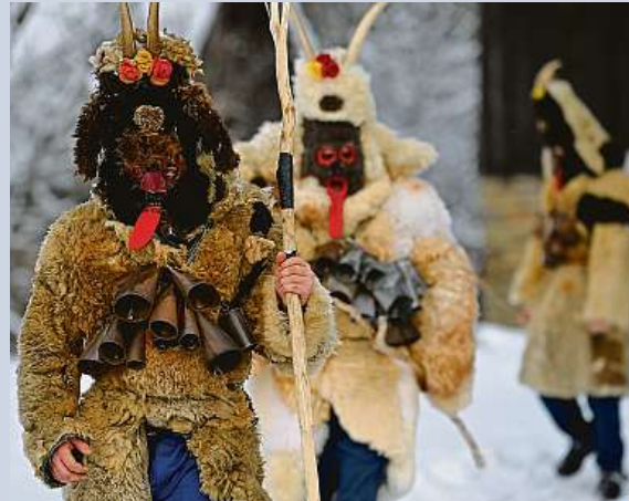
Podle lidového zvyku chodí obcí Lidečko masky svatého Mikuláše, čertů, smrti a koně po tři dny.

Čechy baví show alpských čertů Krampus. Ovšem i Česko má své „hrůzočerty“. Do víšek na Zlínsku vycházejí valašské masky. Vedle čertů jsou tam také smrtky, kobyla i svatí. Podle lidového zvyku chodí obcí masky po tři dny. MET