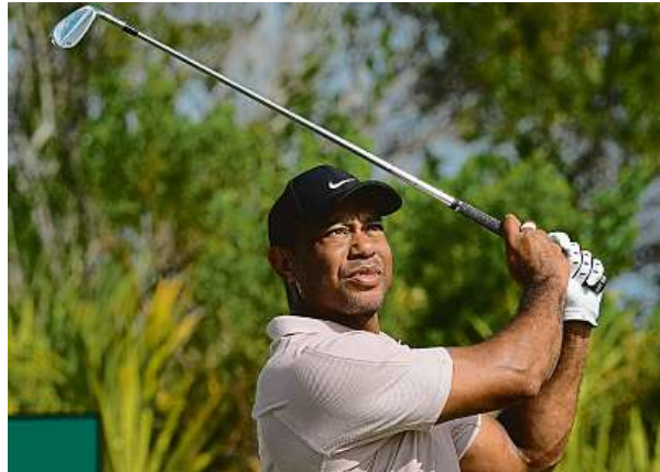
Americký golfista Tiger Woods byl v roce 2007 nejlépe placeným sportovcem světa, když vydělal 122 milionů dolarů.

Sedmačtyřicetiletý Woods v neděli zakončil osmnáctým místem vlastní charitativní turnaj Hero World Challenge. Na Bahamách hrál poprvé od května, kdy odstoupil ze třetího kola Masters. Důvodem byly bolesti nohy, o niž málem přišel po vážné automobilové nehodě v únoru 2021. Woods kvůli tomu od té doby hrál jen sporadicky, nyní však plánuje pravidelnější soutěžní rytmus.