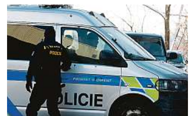
Na pozemním hraničním přechodu Chotěbuz–Cieszyn