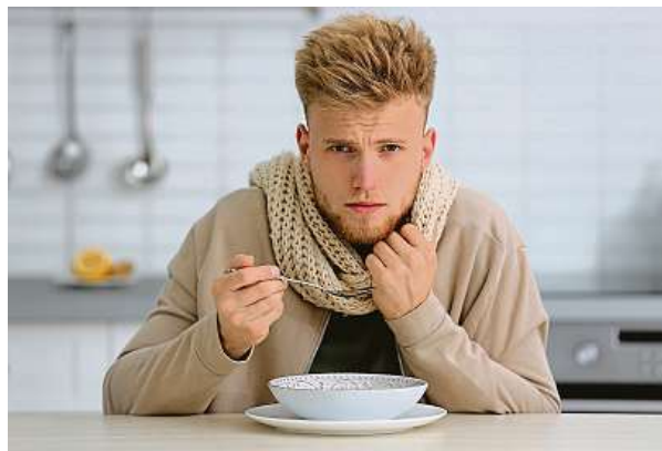
Bez ohledu na věk imunitu oslabí a vyčerpá choroba.

Obránci, kteří jsou součástí imunitního systému, jsou všude v těle – cirkulují v krvi a v lymfě, nacházejí se ve všech orgánech i ve všech tkáních. Pokud fungují správně, když se nic neděje, nereagují. Mají však mechanismy rozpoznávání cizorodých a nežádoucích látek a organismů, a když je zaznamenají, zasáhnu a jsou aktivní, dokud nepřítel nepřestane tělo ohrožovat.