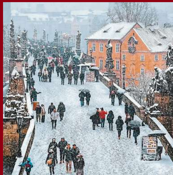
„Chumelí se, chumelí! Po Karlově mostě se rozlila zimní pohádka,“ tetelí se @klara_has. #prag #prague #prageworld #praha #mojemetro #praguecitytourism #milujuprahu #igbest_shots #snow #visitprague #praguestagram #zima #hello_worldpics #travel #instagood #photogram #praguecity #czechrepublic