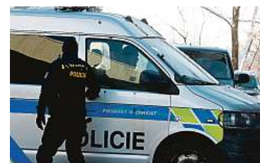
Na pozemním hraničním přechodu Chotěbuz–Cieszyn