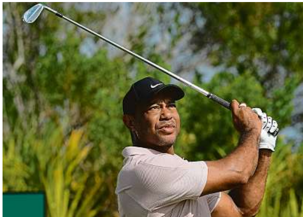
Americký golfista Tiger Woods byl v roce 2007 nejlépe placeným sportovcem světa, když vydělal 122 milionů dolarů.

Sedmačtyřicetiletý Woods v neděli zakončil osmnáctým místem vlastní charitativní turnaj Hero World Challenge. Na Bahamách hrál poprvé od května, kdy odstoupil ze třetího kola Masters. Důvodem byly bolesti nohy, o niž málem přišel po vážné automobilové nehodě v únoru 2021. Woods kvůli tomu od té doby hrál jen sporadicky, nyní však plánuje pravidelnější soutěžní rytmus.