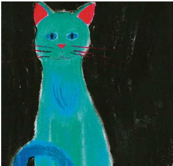
Výherní obrázek letošního ročníku soutěže od třináctileté Magdalény, která ztvárnila kočku Mícu.

Ta v roce 2011 na jedné sportovní akci na podporu lidí s epilepsií připravila stůl s výtvarnými potřebami, aby zabavila děti. „U stolu bylo stále plno a obrázky, které tam vznikly, byly v rámci akce odměněny drobnými dárčky. A tam jsme získali zpětnou vazbu od jedné maminky dítěte s epilepsií, jak moc takové ocenění pro něj znamená. Reakce obou, maminky i nemocného syna, byla tak upřímně pozitivní, přímo nadšená. A obrázek, který mám dodnes zarámovaný, je opravdu krásný,“ konstatuje Bártová. Tak vznikla myšlenka uspořádat pro takto nemocné děti výtvarnou soutěž, aby mohli všichni vidět, že jsou šikovné a plné fantazie. Organizátoři soutěže pozorují ze strany dětí stále větší ohlas. „Od spolupracu-