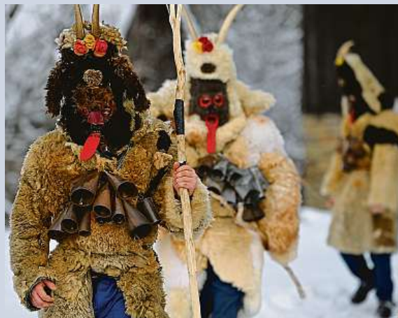
Podle lidového zvyku chodí obcí Lidečko masky svatého Mikuláše, čertů, smrti a koně po tři dny. ČTK

Čechy baví show alpských čertů Krampus. Ovšem i Česko má své „hrůzočerty“. Do víšek na Zlínsku vycházejí valašské masky. Vedle čertů jsou tam také smrtky, kobyla i svatí. Podle lidového zvyku chodí obcí masky po tři dny. MET