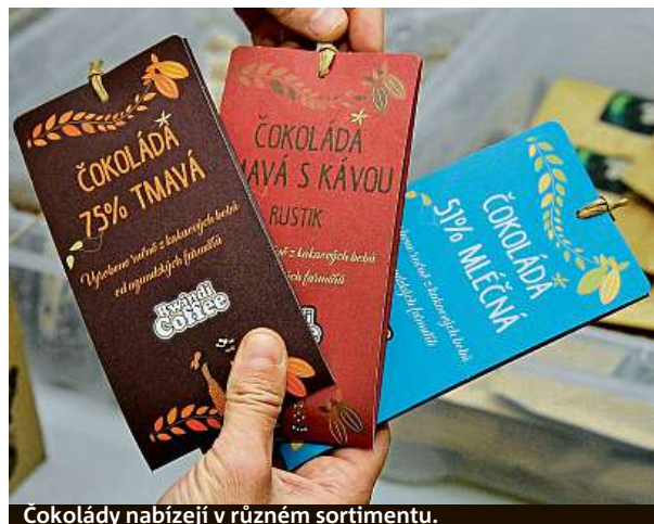
Čokolády nabízejí v různém sortimentu.

Mezi zákazníky patří jednotlivci či firmy, které mají zájem jednak o kvalitní kávu ve svých kancelářích, jednak je zajímavý sociální kontext. Firma začala z Ugandy dovážet také sušené ovoce, jako je například ananas či banány, a také kakaové boby, které si dává zpracovávat v čokoládovně v Hradci Králové. „Vškerým cílem obchodu je snažit se pomoci dětem a farmářům,“ sdělila Chaveau. Uganda patří i v porovnání s africkými státy k chudším a má jednu z nejrychleji rostoucích populací. Hlavním turistickým cílem je národní park Bwindi, kde lze pozorovat horské gorily. ČTK