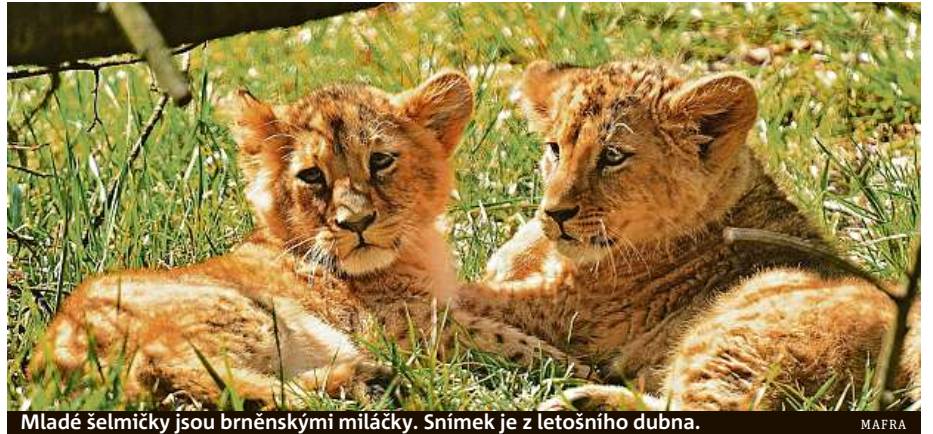
Mladé šelmičky jsou brněnskými miláčky. Snímek je z letošního dubna.

Lvíčata teprve na jaře začala prozkoumávat venkovní expozici, což se odrazilo i na návštěvnosti. V dubnu podle Vaňáče zoo navštívilo asi 51 500 lidí, z pohledu návštěvnosti zahrady šlo o nejúspěšnější duben za posledních 20 let. Více než 50 tisíc návštěvníků za jeden měsíc se do zoo podívá spíše v hlavní sezóně, tedy v červenci či srpnu. „Letošní srpen ale především kvůli vedrům návštěvnosti nepřál, přišlo asi 40 tisíc lidí. I v květnu se do zoo přišlo podívat více lidí, asi 45 tisíc,“ uvedl Vaňáč. Zoo má otevřeno celoročně, do konce roku navíc pořádá ještě několik akcí, které obvykle navštěvují stovky lidí, rekordů z