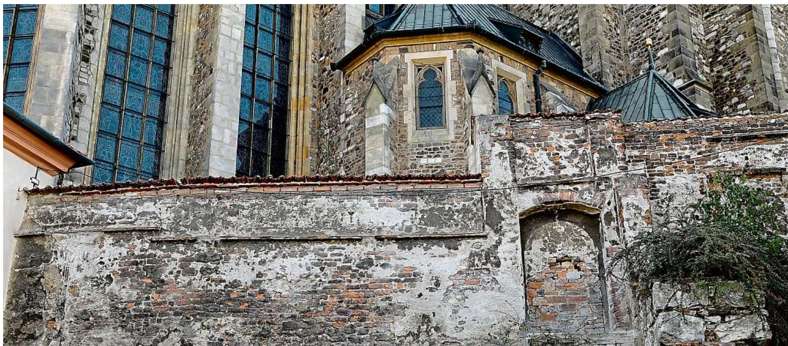
Opěrná zed' Petrova byla postavena v éře přemyslovských králů.

Jednu z nejstarších dochovaných staveb ve městě zkoumali odborníci z brněnské společnosti Archaia.