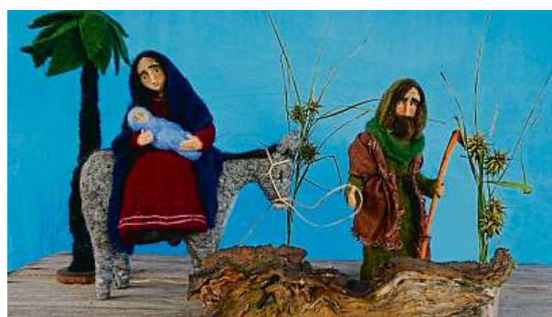
Dvě zajímavé výstavy – Umění loutky (na snímku vlevo), prohlédnout si můžete také betlém (vpravo).

MUZEUM MĚSTA BRNA a 2x LETOHRÁDEK MITROVSKÝCH