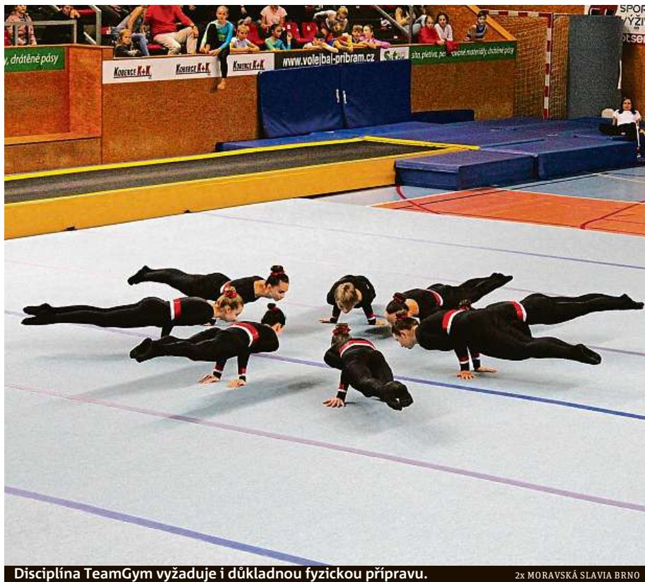
Disciplína TeamGym vyžaduje i důkladnou fyzickou přípravu.