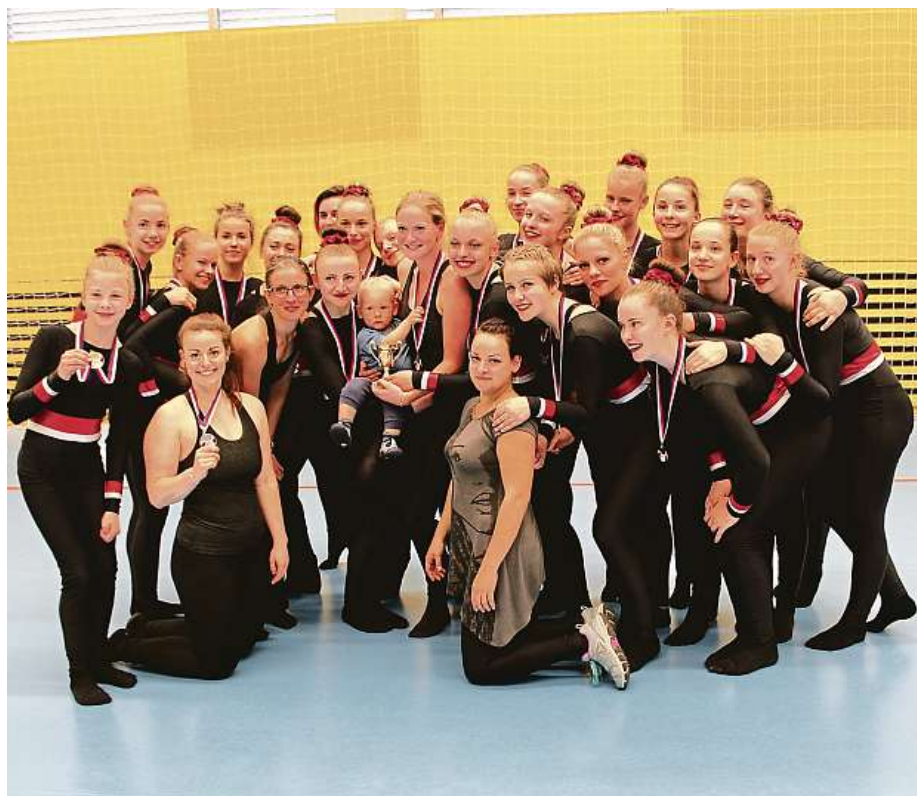
Gymnastky z Moravské Slavie Brno slavně vítězí na republikové i mezinárodní úrovni.

Juniorky trénují třikrát týdně vždy dvě a půl hodiny. Roční příspěvek vyjde rodiče na pět tisíc korun, klub hradí dopravu a startovné na závodech a zajišťuje závodní oblečení.