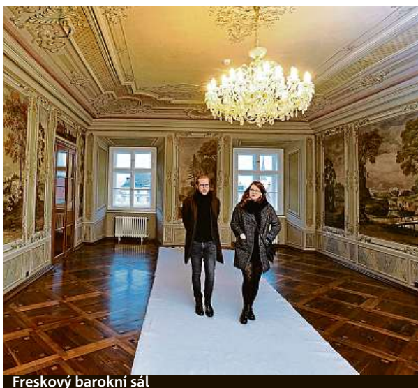
Freskový barokní sál

by vás někdo otravoval,“ popsal Vlachynský. Trojici podniků v budově doplňuje Elsner Bistro s řemeslnou pekárnou a cukrárnou, vinným barem a bufetem, který může být zdrojem občerstvení i pro hosty hotelu Anybody. Kromě netradičních podniků je ve vnitrobloku paláce k vidění i jedna z největších vertikálních zahrad v Česku, ve vnitřním traktu je jedna ze stěn o rozloze 108 čtverečních metrů osazená rostlinami. Má zlepšovat mikroklima a vzduch v domě. Hosté si dnes kromě toho mohli prohlédnout i freskový sál s malbami z konce 18. století.