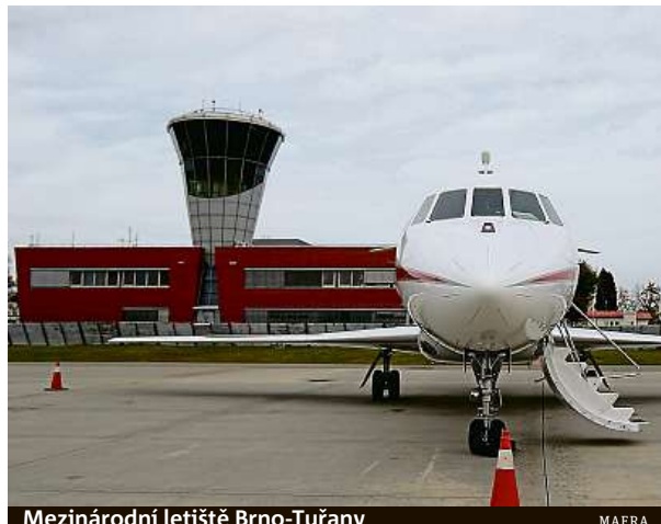
Mezinárodní letiště Brno-Tuřany