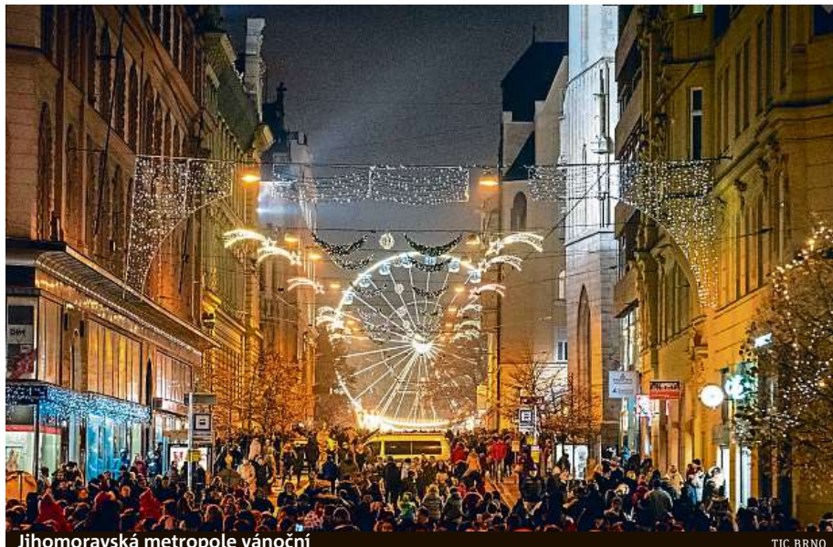
Jihomoravská metropole vánoční

TSB zajišťují slavnostní osvětlení historického centra města, které tvoří zhruba třetinu výzdoby celého Brna, a to jak do počtu ozdob, tak do příkonu. „Na tom, aby do zahájení trhů bylo vše připraveno, pracovali nejen naši zaměstnanci, ale i technika. Takřka denně jsme plně využívali pět vysokozdvizných plošin. Další vozidla sloužila k navážení dřevěných stánků a ostatního materiálu potřebného pro