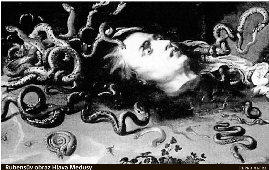
Rubensův obraz Hlava Medusy

Hlava Medusy patří k nejvýznamnějším uměleckým dílům dochovaným na českém území. V roce 1818 obraz věnoval hrabě von Nimptsch tehdejšímu Františkovu muzeu, jehož sbírky nyní tvoří základ fondů starého umění Moravské galerie. Dílo však bylo od počátku považováno