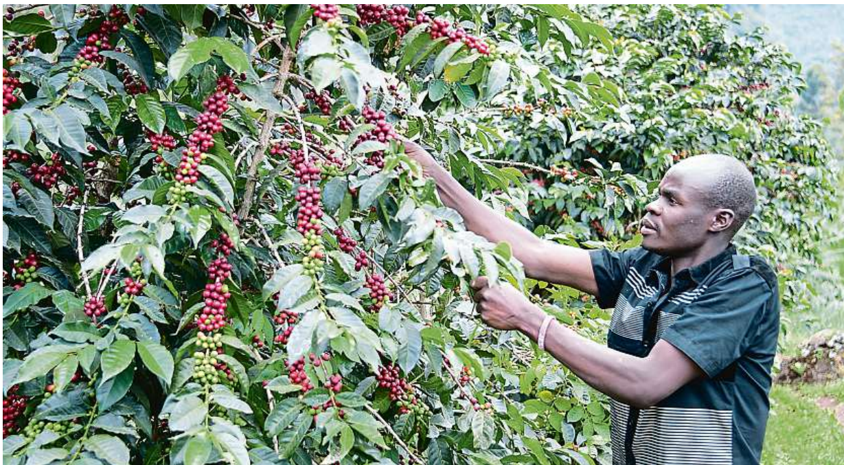
Skleň kávových bobů v Ugandě na snímku z 19. listopadu 2017