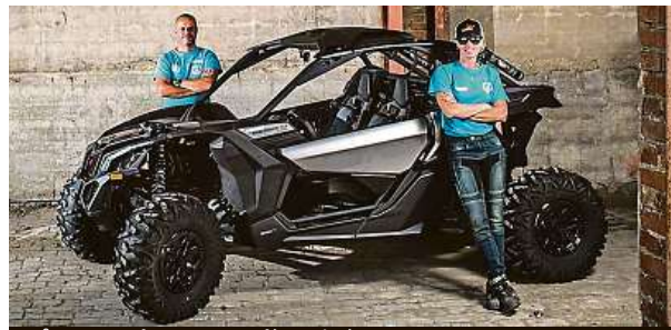
Vůz pro Dakar, v pozadí navigátor

Pokorně musím napsat, že mám co zlepšovat, hlavně na rychlosti a čtení roadbooku. Nečekala jsem, že svůj první Dakar dojezu na bedně. Nejen to, že jsem první ženou z České republiky, která Dakar dojezu do cíle, ale nám