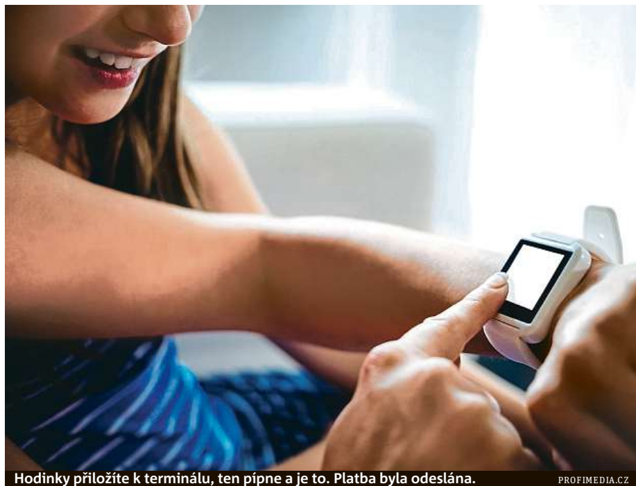
Hodinky přiložíte k terminálu, ten pípne a je to. Platba byla odeslána.

Hodinkami můžete platit všude tam, kde je k dispozici bezkontaktní platební terminál, tedy nejen v obchodech, ale také při parkování, zakoupení jízdenky na MHD nebo například na koupališti. MET