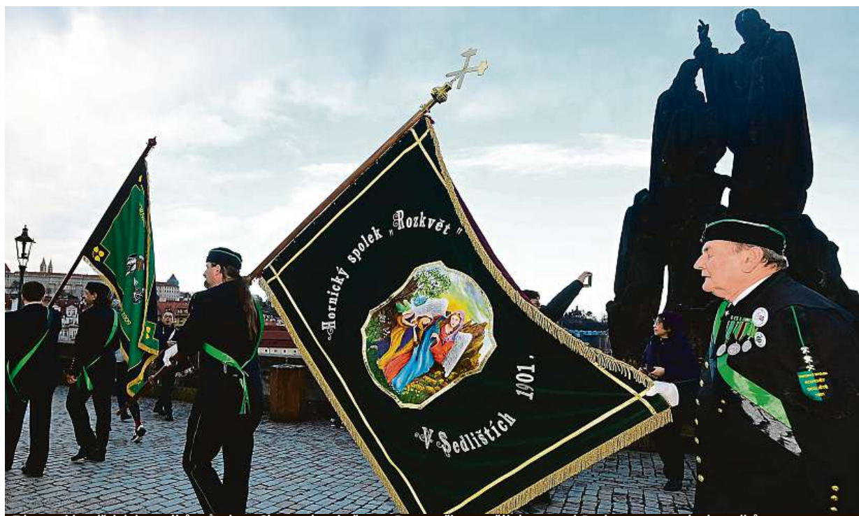
Zástupci havířských spolků z Česka a Slovenska si včera v Praze připomněli den svaté Barbory, patronky horníků.

31 516 korun. Taková byla průměrná česká mzda ve třetím čtvrtletí. Firmy v ohrožení. Navzájem si přetahují zaměstnance, peníze jim mohou chybět jinde. Práce snů. Nejvíc letos přidal stát STRANA 3