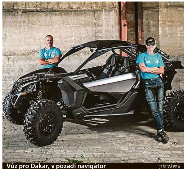
Vůz pro Dakar, v pozadí navigátor

Zasednu za volant Can Amu Maverick XRS. Už při odletu z Dakaru jsem koketovala