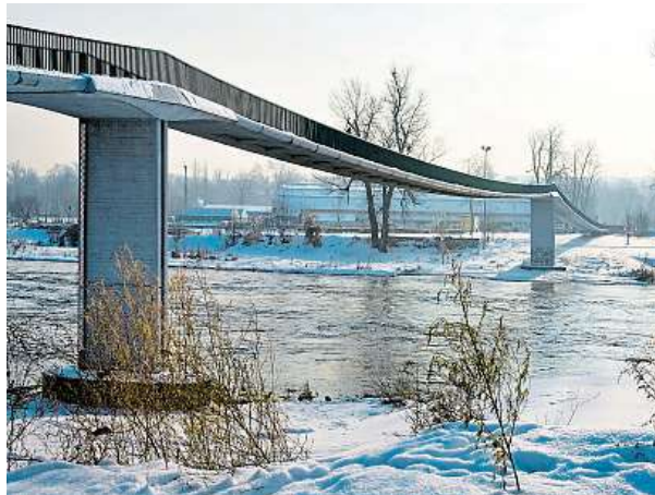
Takhle lávka vypadala. V létě přes ni dennodenně procházejí tisíce lidí.