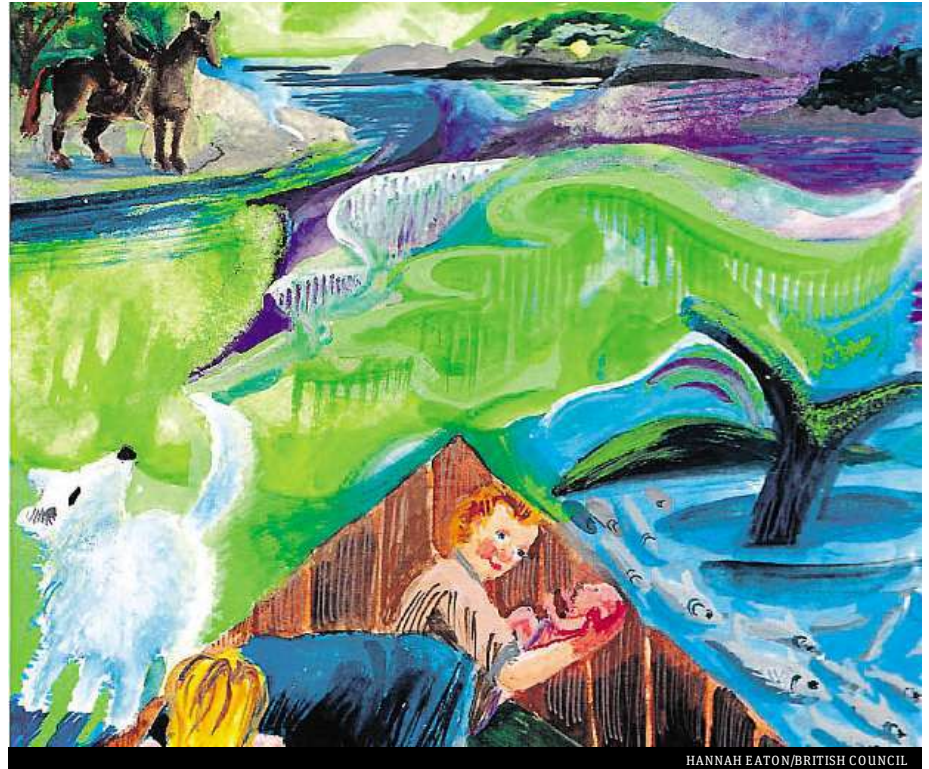
HANNAH EATON/BRITISH COUNCIL

In this series you will learn about myths and legends from various parts of the world.