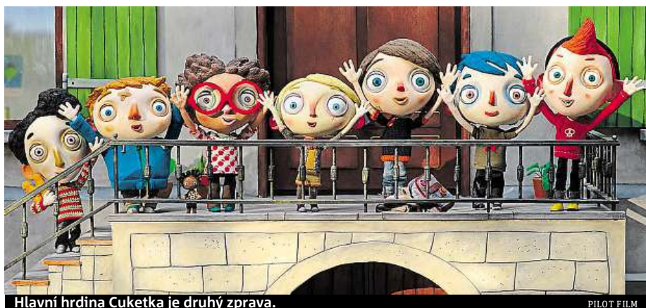
Hlavní hrdina Cuketka je druhý zprava.