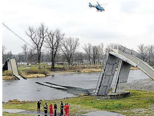
Takhle lávka vypadala. V létě přes ni dennodenně procházejí tisíce lidí.