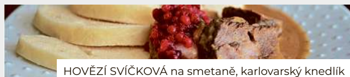
HOVĚZÍ SVÍČKOVÁ na smetaně, karlovarský knedlík

eFiShop.cz ROZVOZ PO BRNĚ A OKOLÍ DO 25 KM