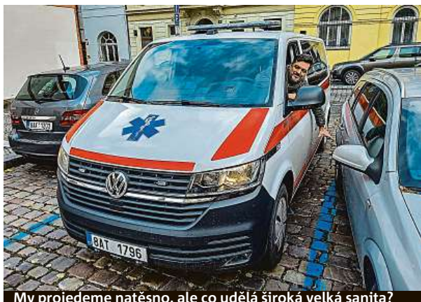
My projedeme natěsno, ale co udělá široká velká sanitka?

ci opravdové záchranky musí být opravdu frajeři. Když se kolem nás kvapně prohnalo na Smetanově nábřeží na dohled od Národního divadla žluté sanitní vozidlo, byly jsme rádi, že to může drandit po prázdném tramvajovém tělese. Zdaleka ne všechny pražské ulice podobné zkratky mají a tam, kde jsou dostatečně široké, zase stále častěji vyplňují koleje travnaté pásy. Pracovníci záchranky si přesto musí umět poradit a proklíčkovat. Mají náš obdiv. FILIP JAROŠEVSKÝ