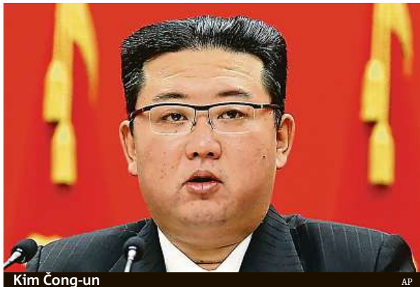
Kim Čong-un

V severokorejské diktatuře se nejspíš schyluje k malé revoluci.