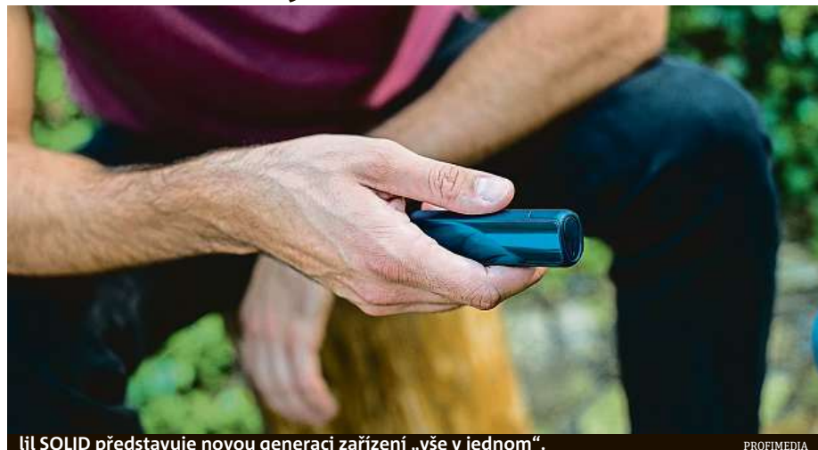
Ili SOLID představuje novou generaci zařízení „vše v jednom“.