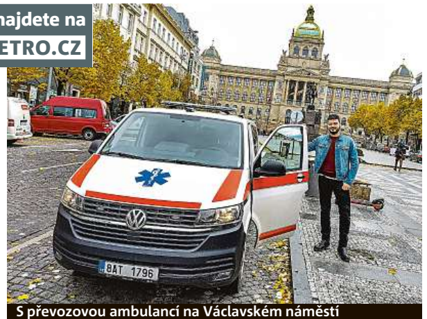
S převozovou ambulancí na Václavském náměstí

a zdravotníci v sanitkách? My už to po několika pokynutích, která se při našich toulkách centrem metropole od mužů zákona nasbírala, víme také. Zároveň nás ale ohromilo, jak úzkými uličkami se běžně skuteční zdravotníci musí s podstatně širšími žlutými sanitními vozy proplétat. V Krakovské ulici kousek od Václavského náměstí jsme se jen tak tak protáhli mezi příčně parkujícími auty a kovovými sloupky ohraničujícími chodník. Ve Pštrossově ulici jsme si pak při průjezdu