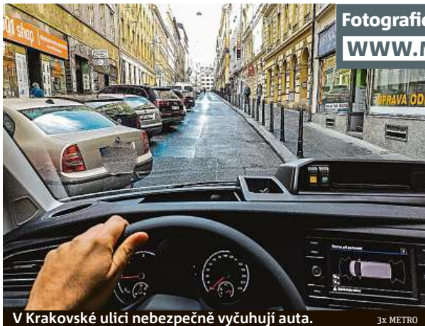
V Krakovské ulici nebezpečně vyčuhují auta.

Věděli jste, že se mezi sebou přátelsky zdraví policisté