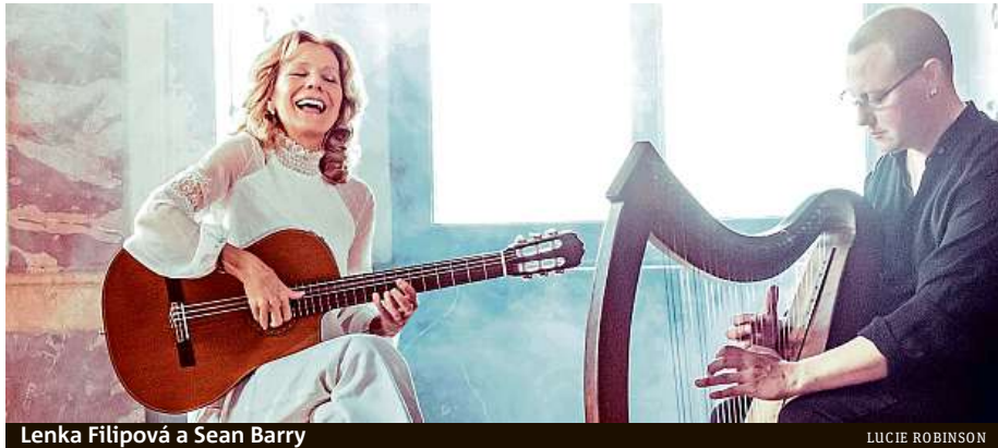
Lenka Filipová a Sean Barry