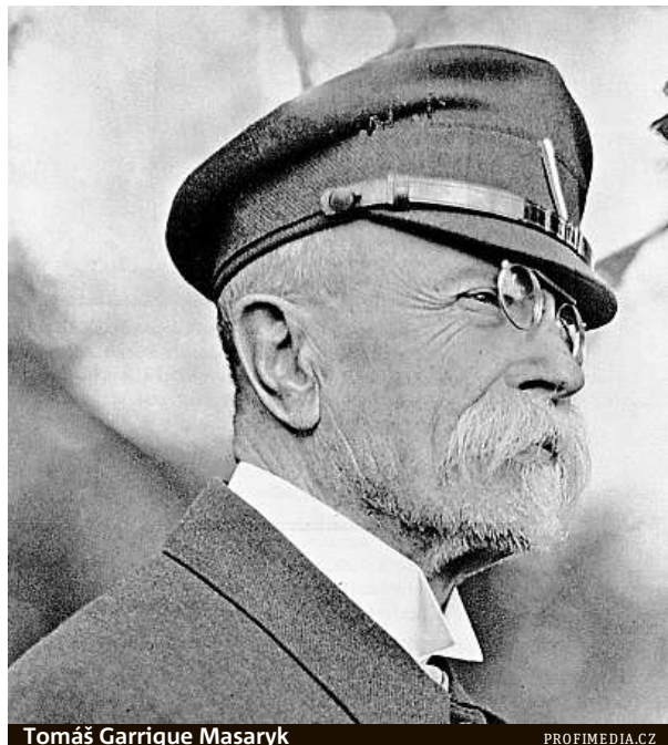
Tomáš Garrigue Masaryk