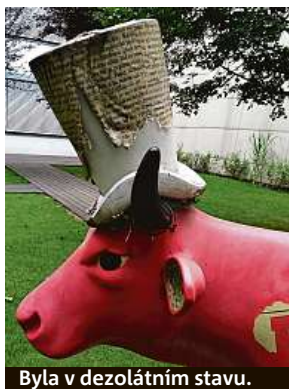
Byla v dezolátním stavu.