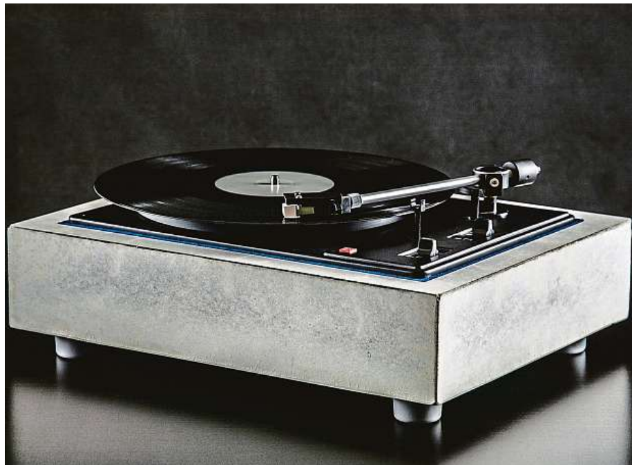
Na Czech Design Weeku uvidíte netradiční věci. Třeba tento těžký gramofon. CZECH DESIGN WEEK