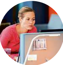
20:20 Specialisté (56) Krimiseriál (ČR, 2018). Maskovní teenageři umrlá neznámého muže a video pověsí na web. Stopy vedou na střední učňovskou školu, neboť zavražděný byl otcem jedné z žákyň, problémové a agresivní Ely. Hrají: D. Prachař, J. Štáfek, Z. Kajnarová, J. Zadražil, M. Šittá a další