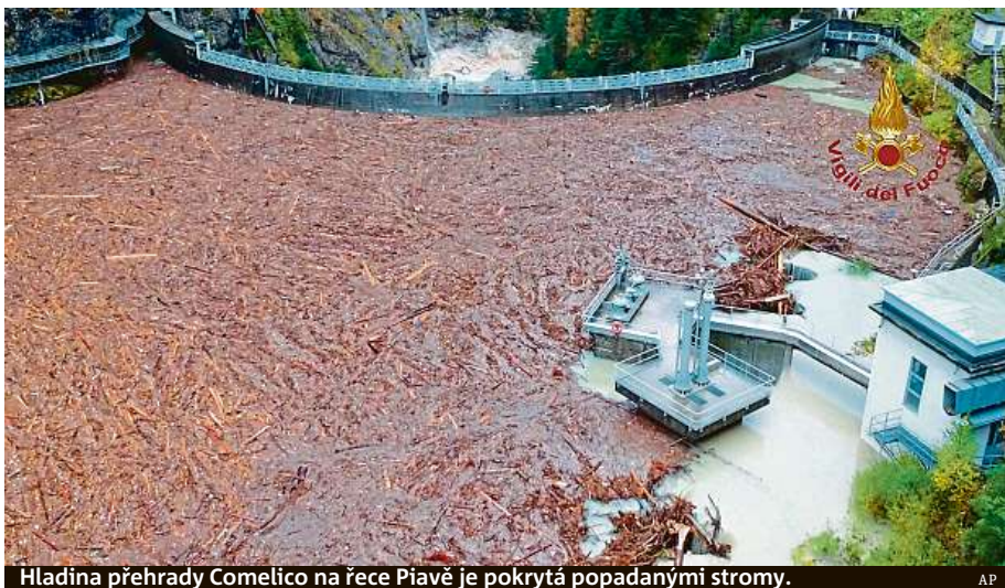
Hladina přehrady Comelico na řece Piavě je pokrytá popadanými stromy.

Jedinečný porost se rozkládá na ploše 2700 hektarů. Tvoří ho převážně smrky, je největším souvislým lesem v italských Alpách a leží v nadmořské výšce od 1500 do 2000 metrů. „Pětina lesa už neexistuje. Stovky hektarů lesa byly zničeny,“ citoval včera deník La Repubblica lesníka Paola Kovace.