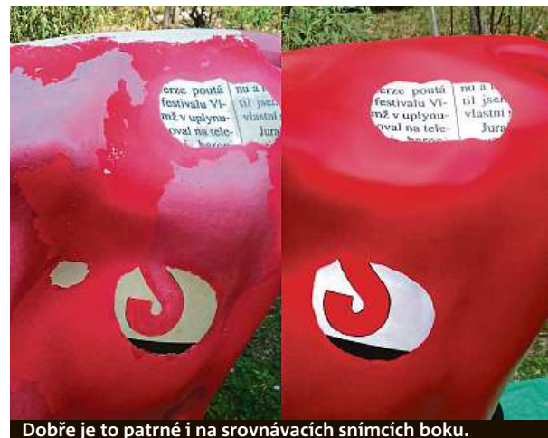
Dobře je to patrné i na srovnávacích snímcích boku.