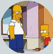
20:15 Simpsonovi XXVI (6) Animovaný seriál (USA, 2014)