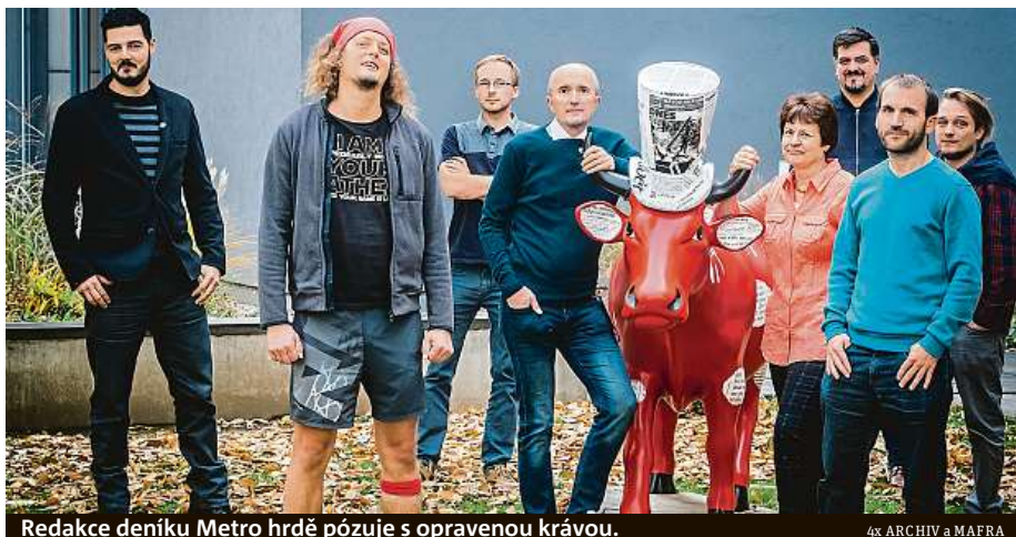
Redakce deníku Metro hrdě pózuje s opravenou krávou.