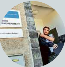
20:10 Lynč (3/8) Dramatický seriál (ČR, 2018)