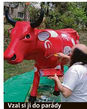
Vzal si ji do parády

FILIP JAROŠEVSKÝ filip.jarosevsky@metro.cz