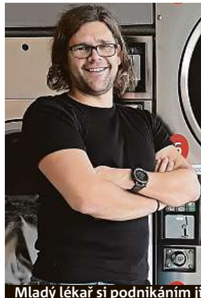
Mladý lékař si podnikáním jistě záda. Provoz řídí i přes mobil, vidí všechno online. 2x METRO