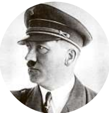
20:00 Úsvit nacismu Jak vypadal Německo, když vstoupilo do druhé světové války?