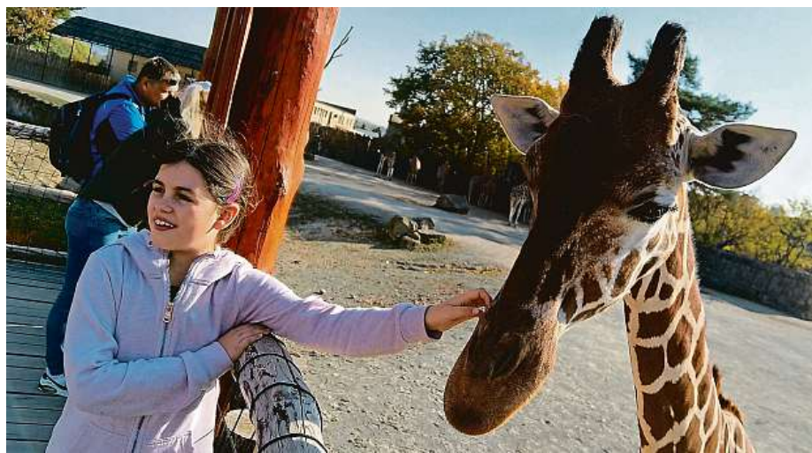
Ke královédvorské zoo odjakživa patří žirafy. Ve výběhu jsme jich napočítali čtrnáct.