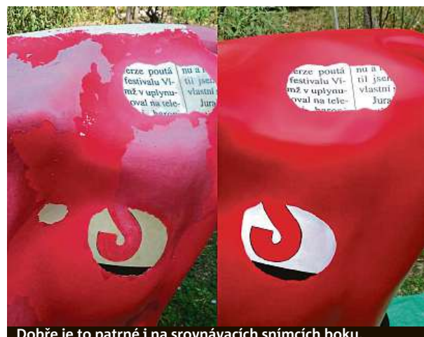
Dobře je to patrné i na srovnávacích snímcích boku.