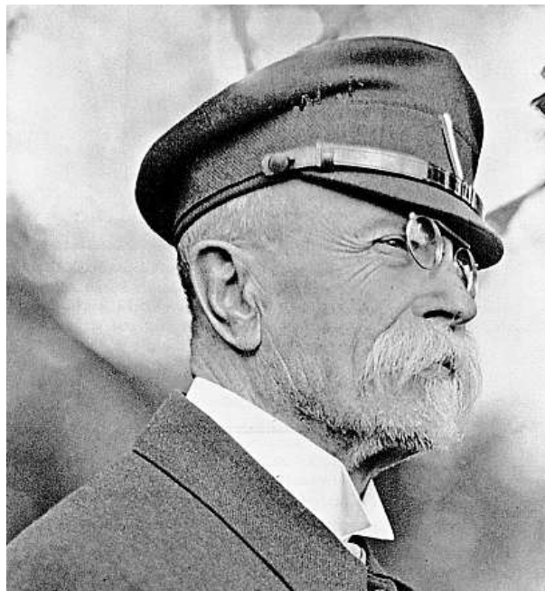
Tomáš Garrigue Masaryk