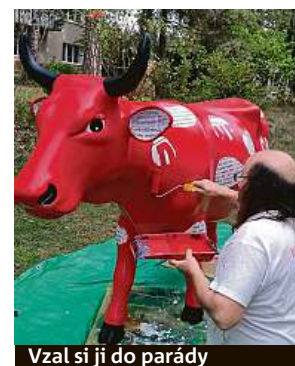
Vzal si ji do parády

FILIP JAROŠEVSKÝ filip.jarosevsky@metro.cz