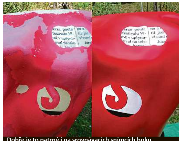
Dobře je to patrné i na srovnávacích snímcích boku.