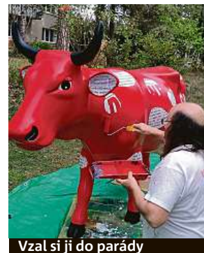
Vzal si ji do parády

FILIP JAROŠEVSKÝ filip.jarosevsky@metro.cz