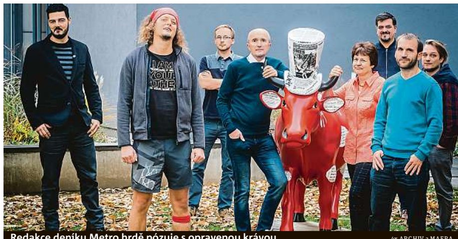
Redakce deníku Metro hrdě pózuje s opravenou krávou.