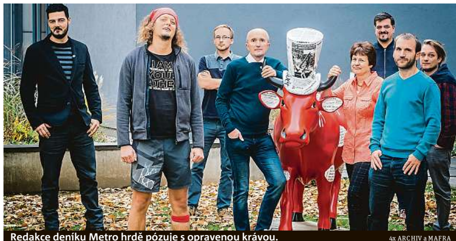
Redakce deníku Metro hrdě pózuje s opravenou krávou.